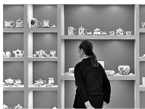
这是一名观众在一个瓷器品牌展架前驻足观看。

前不久,上海举办了“中国品牌日”系列活动,一个个企业以创新打造品牌,用品牌开拓市场的生动故事正在上演。