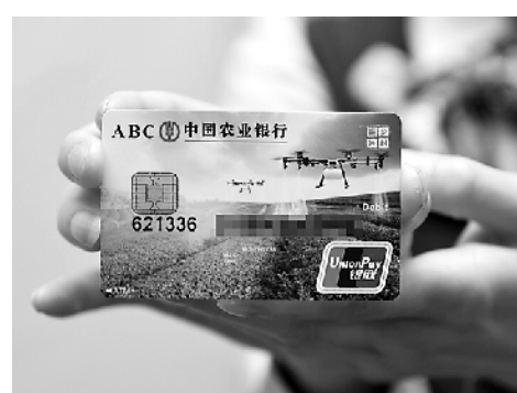
工作人员展示全国首张乡村振兴主题银行卡。

去年,在内外部因素的影响下,民营和小微企业一度面临融资难问题。今年以来,国家多措并举推进金融供给侧结构性改革,定向引导金融活水“精准滴灌”民营和小微企业,稳定市场预期,增强市场信心,为供给侧结构性改革和高质量发展营造适宜的金融环境。