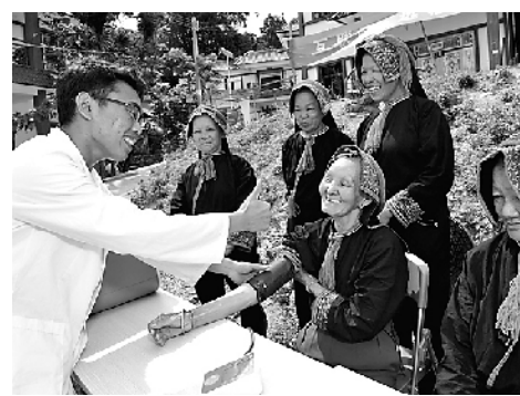
医护人员为海南省五指山市水满乡群众测血压。

经济发展的“速度”最终要落脚在民生保障的“温度”。今年以来,我国经济增长、就业、物价、国际收支都呈现稳的态势,积极因素不断增加,为全年走势打下向好基础。民生保障更加有力,百姓在发展中获取更多实惠。