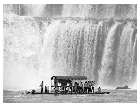
大批游人乘坐竹筏在广西崇左大新县观赏瀑布。