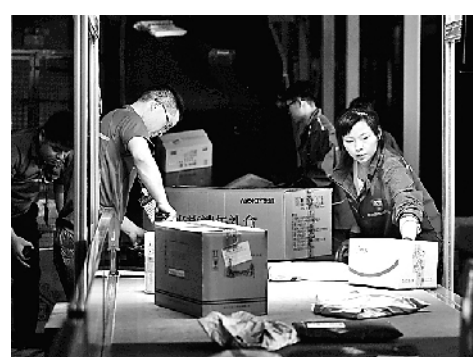
现代物流业发展为城乡协调发展提供了便利。

新型城镇化和乡村振兴同频共振,城乡融合发展释放持久动能;重大区域发展战略打通区域协调发展“经络”,各大区域板块良性互动;高水平开放联通国内外市场……今年以来,我国城乡区域空间不断拓展,结构持续优化,资源配置效率全面提升,在融合联通中,我国以城市群为主体的城镇化格局持续完善,为经济高质量发展创造新机遇、注入