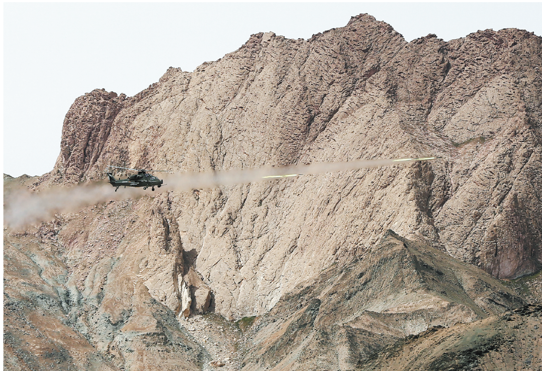
7月中旬，第77集团军某旅在高原组织直升机突防演练，破解高原作战难题。

陆续开始搬家。一名机关干部私下从曾经任职的连队叫来几名公差“搭手帮忙”。旅党委得知此事后，责令这名机关干部和连队主官在旅军人大会上作检查，进一步树牢“珍惜战斗力成本，严禁挤占训练时间”的意识。