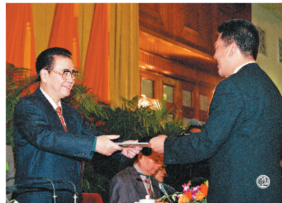
图⑫:1998年5月5日,全国人民代表大会澳门特别行政区筹备委员会在北京人民大会堂宣告成立并举行第一次全体会议。这是李鹏同志作为筹备委员会副主任委员何厚铨颁发任命书。

划和2010年远景目标,布局建设一批国家重大项目,推动国民经济持续快速健康发展。