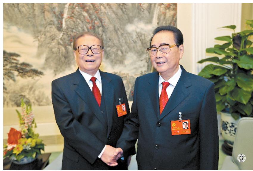
图③:2012年11月8日,在党的十八大开幕前,江泽民同志同李鹏同志在一起。