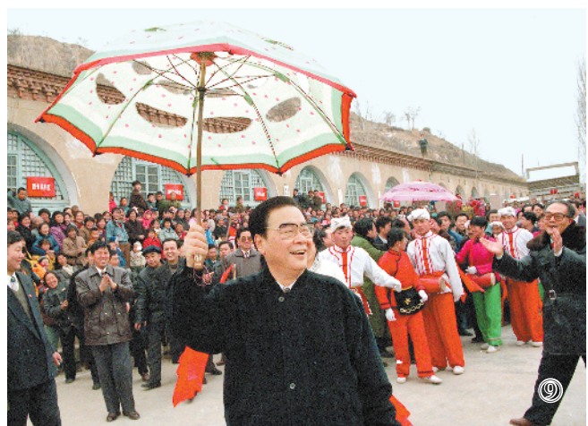
图⑨:1996年2月19日至20日,李鹏同志回到阔别50年的延安,看望、慰问延安地区的干部群众,和老区人民一起过年。这是大年初一,李鹏同志同枣园村秧歌队一起扭起陕北秧歌。