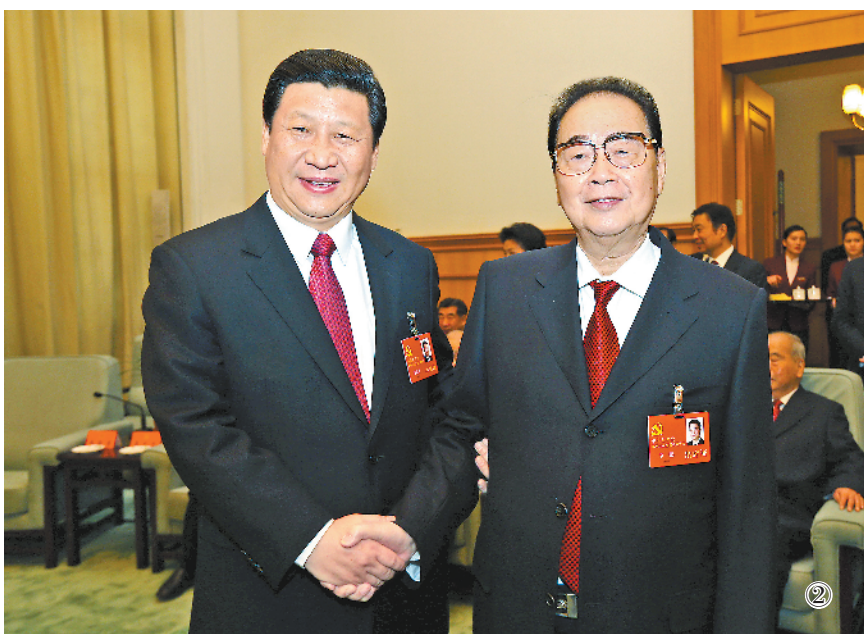
图②:2012年11月14日,在党的十八大闭幕前,习近平同志同李鹏同志在一起。新华社记者 兰红光摄