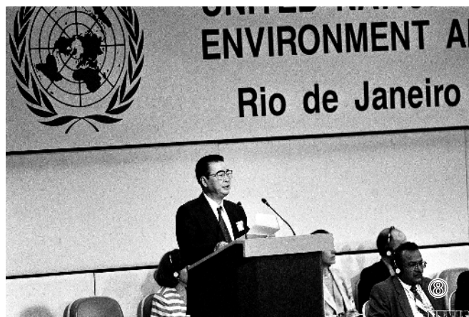
图⑧:1992年6月12日,李鹏同志在联合国环境与发展大会首脑会议上发言。