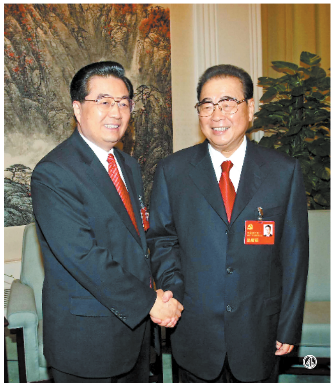
图④:2007年10月21日,在党的十七大闭幕前,胡锦涛同志同李鹏同志在一起。