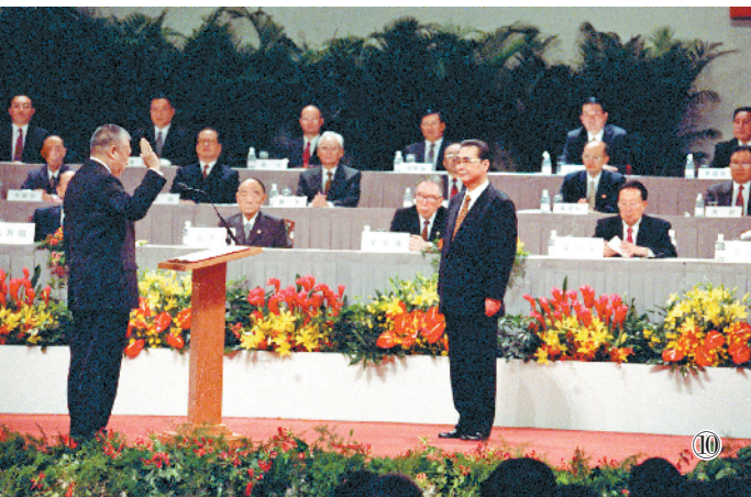
图⑩:1997年7月1日凌晨,中华人民共和国香港特别行政区成立暨特区政府宣誓就职仪式在香港会议展览中心新翼七楼隆重举行。香港特区首任行政长官董建华宣誓就职,李鹏同志监誓。

1992年10月,李鹏同志在中共十四届一中全会上再次当选为中央政治局委员、常委。1993年3月,在八届全国人大一次会议上,他再次被任命为国务院总理。邓小平同志发表南方谈话后,他积极支持、宣传和贯彻邓小平同志改革开放的思想主张,坚决贯彻党的十四大精神,加快社会主义市场经济体制改革步伐,扩大对外开放,加强和改善宏观调控,在党中央领导下主持制定国民经济和社会发展“九五”计