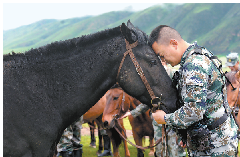
尼都塔生爱马如同爱战友和兄弟。