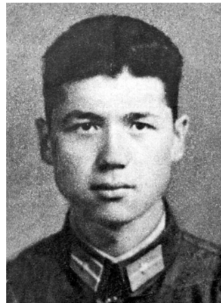
司马义·买买提像（资料照片）。新华社发

自治区党委和新疆军区决定修建叶城烈士陵园，2009年3月经国务院批准为国家级烈士陵园。