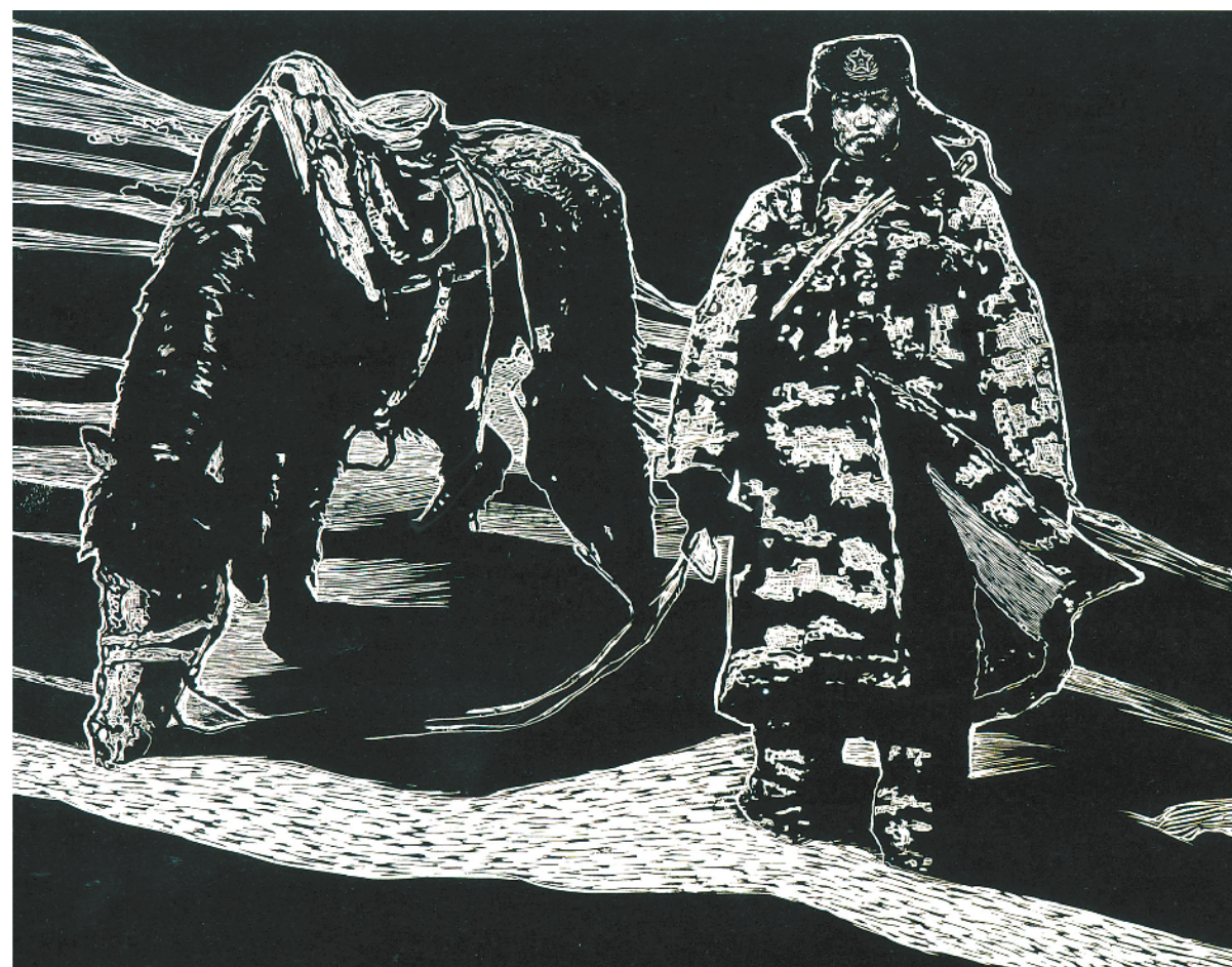
雪域之魂(版画) 赖登云 陈健 陈方勇作