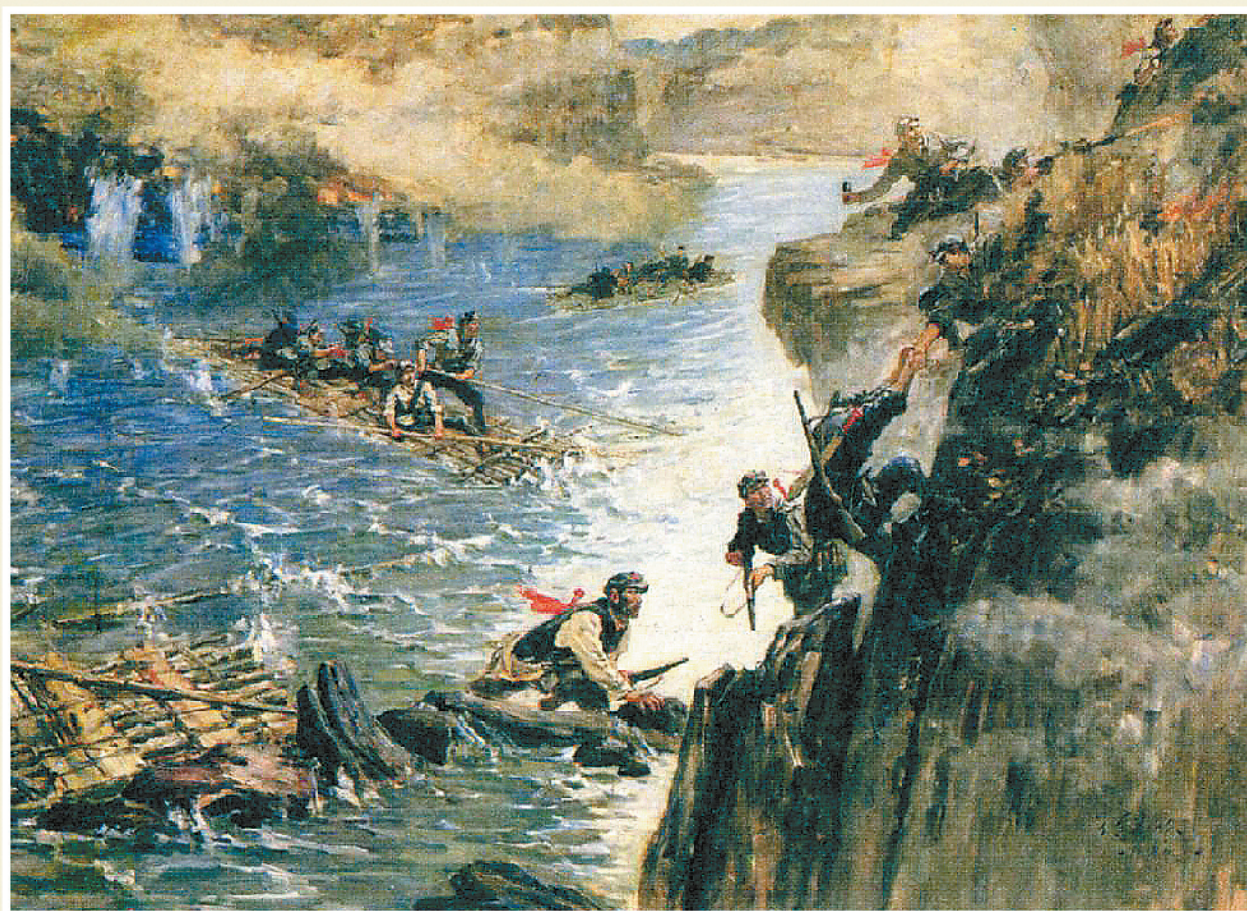
强渡乌江(油画) 魏传义作