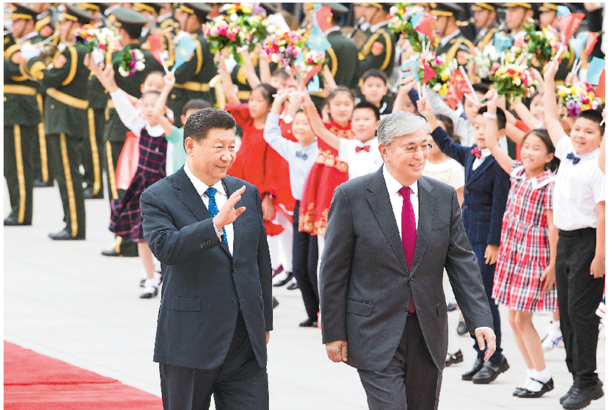
九月十一日,国家主席习近平在北京人民大会堂同哈萨克斯坦总统托卡耶夫举行会谈。这是会谈前,习近平在人民大会堂东门外广场为托卡耶夫举行欢迎仪式。新华社记者 黄敬文摄

新华社北京9月11日电 (记者孙奕)国家主席习近平11日在人民大会堂同哈萨克斯坦总统托卡耶夫举行会谈。两国元首一致决定,双方将本着同舟共济、合作共赢的精神,发展中哈永久全面战略伙伴关系。 习近平说,再过十几天,我们将隆重庆祝中华人民共和国成立70周年。70年来,中国共产党带领中国人民取得举世瞩目的伟大成就,正朝着实现中华民族伟大复兴的目标迈进。这一进程从来都不会一帆风顺,但无论外部形势如何变化,中国都将坚定不移、心无旁骛地做好自己的事,全面深化改革,扩大对外开放,推动实现更高质量发展。我们完全有能力应对好各种风险挑战,任何艰难险阻都阻挡不了我们前进的步伐。一个稳定、开放、繁荣的中国将始终是世界未来发展的机遇。 习近平指出,中哈关系是睦邻友好