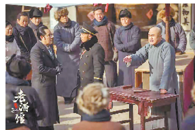
电视剧《老酒馆》剧照