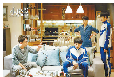
电视剧《小欢喜》剧照