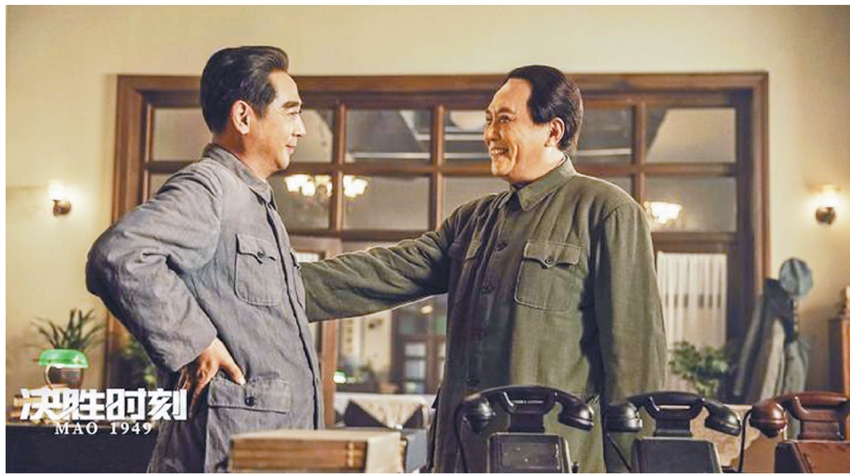
电影《决胜时刻》剧照