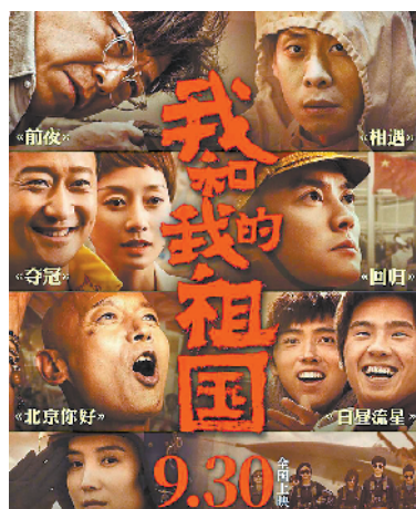
电影《我和我的祖国》海报