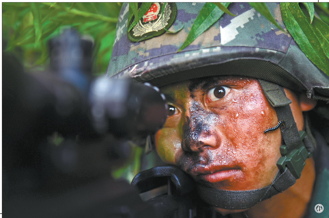
图④:训练中,一只千足虫爬上尔只伍甲的脸颊,他却一动不动。