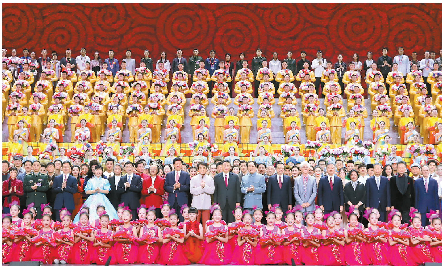
9月29日,庆祝中华人民共和国成立70周年大型文艺晚会《奋斗吧 中华儿女》在北京人民大会堂举行。习近平、李克强、栗战书、汪洋、王沪宁、赵乐际、韩正、王岐山等党和国家领导人同4000多名观众一起观看演出。演出结束后,习近平等走上舞台同演职人员合影留念。

新华社北京9月29日电 (记者刘华、朱基钗)七十载沧桑巨变,七十载壮丽征程。庆祝中华人民共和国成立70周年大型文艺晚会《奋斗吧 中华儿女》29日晚在京举行。习近平、李克强、栗战书、汪洋、王沪宁、赵乐际、韩正、王岐山等党和国家领导人,同4000多名观众一起观看演出,共同回顾新中国成立70年来的辉煌历程,共同祝福伟大祖国的美好前程。 人民大会堂万人大礼堂处处欢声笑语。二楼舞台的横幅格外醒目:紧密团结在以习近平总书记为核心的党中央周围,不忘初心、牢记使命,奋力夺取新时代中国特色社会主义伟大胜利!大会堂天幕上,投映着姹紫嫣红的鲜花图案,营造出热烈喜庆的气氛。两面红旗造型的舞台墙矗立在台口,36名仪仗兵分列两侧。 19时55分,在欢快的乐曲声中,习近平等领导同志步入大礼堂,同老同志代表亲切握手,向他们致以崇高敬意,全场响起热烈掌声。 “没有共产党就没有新中国……”随着一曲振奋人心的旋律响起,大型音乐舞蹈史诗《奋斗吧 中华儿女》拉开帷幕。 晚会以“奋斗”为主线,共分为四个篇章。 第一篇章“浴血奋斗”一开场,交响乐与舞蹈《起来 起来》便将人们的记忆带回中华民族苦难深重的岁月,随后激昂的歌舞《国际歌》再现中国共产党成立这一开天辟地的大事变,交响乐、合唱和舞蹈《南昌起义》《西江月·井冈山》《过雪山草地》《延安颂》《怒吼吧 黄河》《渡江 渡江》等以时间的脉络,生动展现中国共产党团结带领中国人民经过28年艰苦卓绝斗争建立新中国的伟大历程。 第二篇章“艰苦奋斗”以绚丽宏大的合唱和舞蹈《东方红》开篇,回顾新中国热火朝天的社会主义革命和建设年代。《赞歌》《翻身农奴把歌唱》唱出各族儿女开启新生活的无尽喜悦,《英雄赞歌》《我的祖