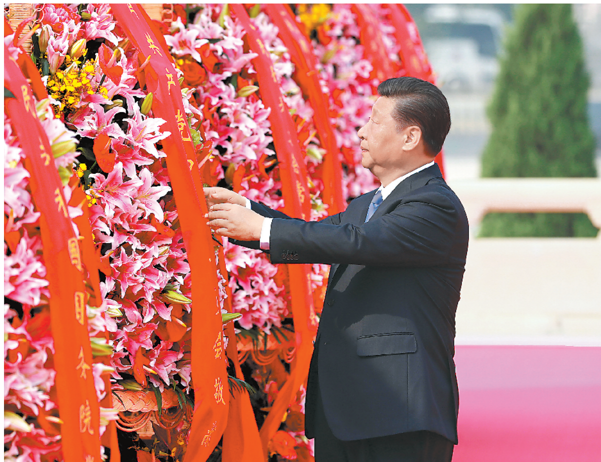
9月30日上午,习近平、李克强、栗战书、汪洋、王沪宁、赵乐际、韩正、王岐山等党和国家领导人来到北京天安门广场,出席烈士纪念日向人民英雄敬献花篮仪式。这是习近平整理花篮上的缎带。