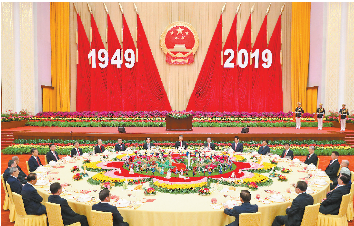
9月30日晚,庆祝中华人民共和国成立70周年招待会在北京人民大会堂隆重举行。习近平、李克强、栗战书、汪洋、王沪宁、赵乐际、韩正、王岐山等党和国家领导人与4000余名中外人士欢聚一堂,共庆新中国70华诞。

新华社北京9月30日电 (记者杨维汉、罗争光)庆祝中华人民共和国成立70周年招待会30日晚在人民大会堂隆重举行。中共中央总书记、国家主席、中央军委主席习近平出席招