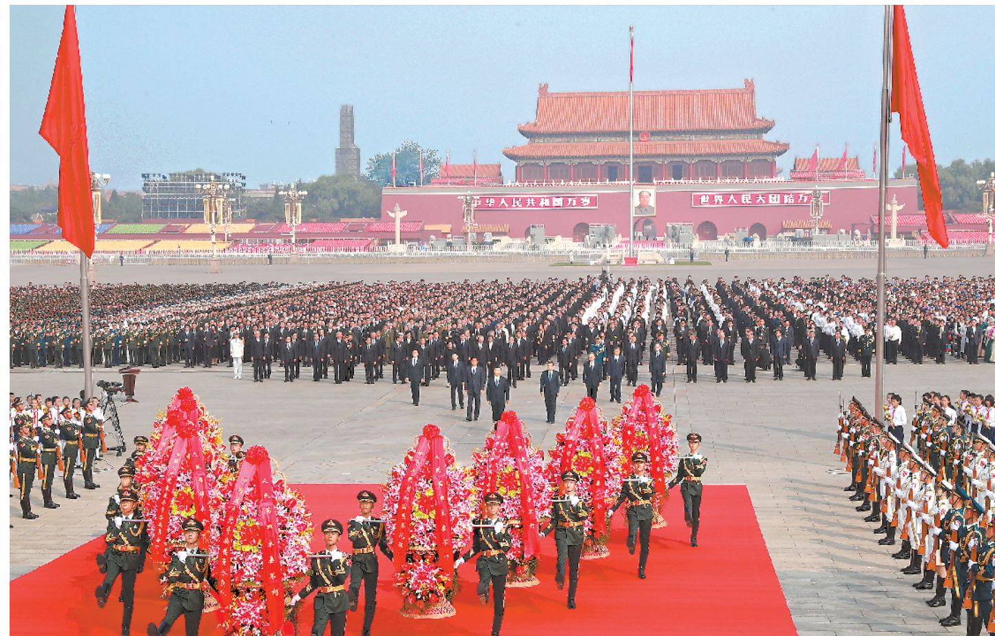
9月30日上午,习近平、李克强、栗战书、汪洋、王沪宁、赵乐际、韩正、王岐山等党和国家领导人来到北京天安门广场,出席烈士纪念日向人民英雄敬献花篮仪式。

新华社北京9月30日电 (记者杨维汉、罗沙)在庆祝中华人民共和国成立70周年之际,烈士纪念日向人民英雄敬献花篮仪式30日上午在北京天安门广场隆重举行。习近平、李