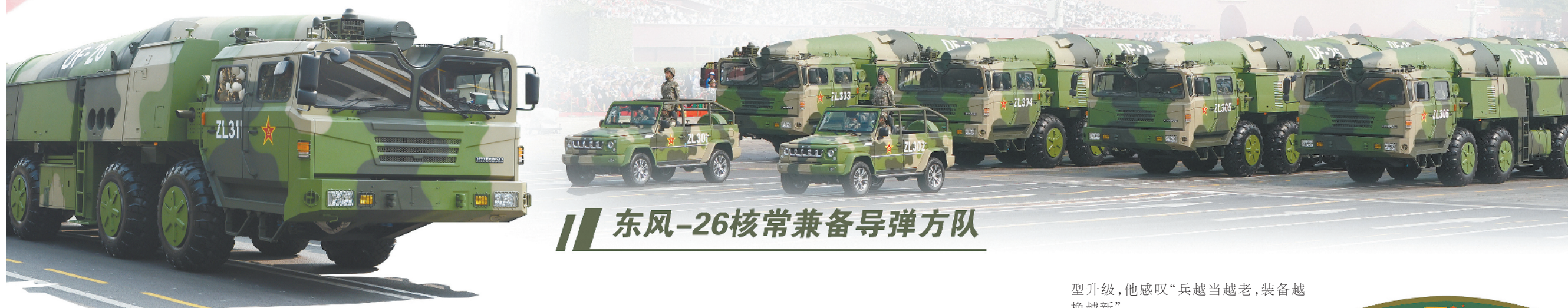
东风-26核常兼备导弹方队