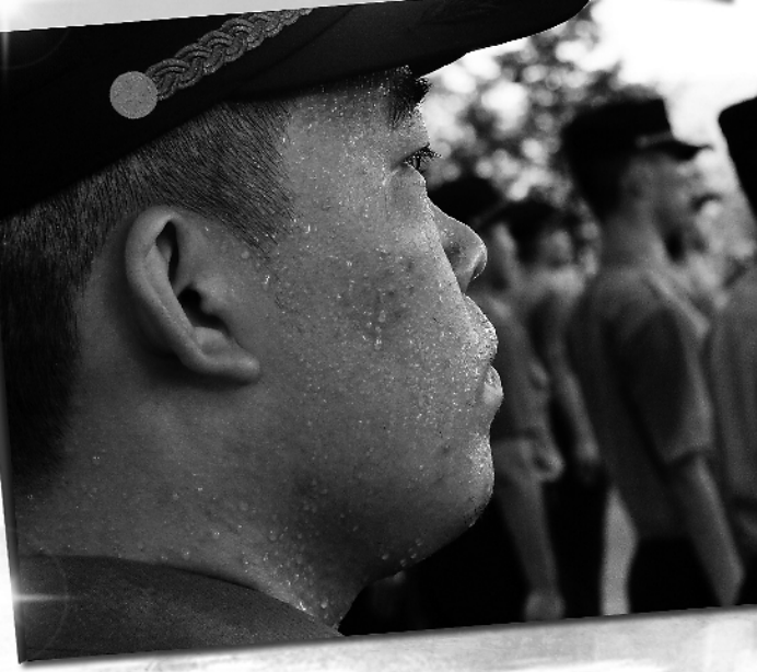
滴落的汗水、冲天的吼声、坚毅的目光……在火热的训练场，国防科技大学2019级新学员经历了一场特殊的“成人礼”。