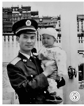
致敬甘巴拉。