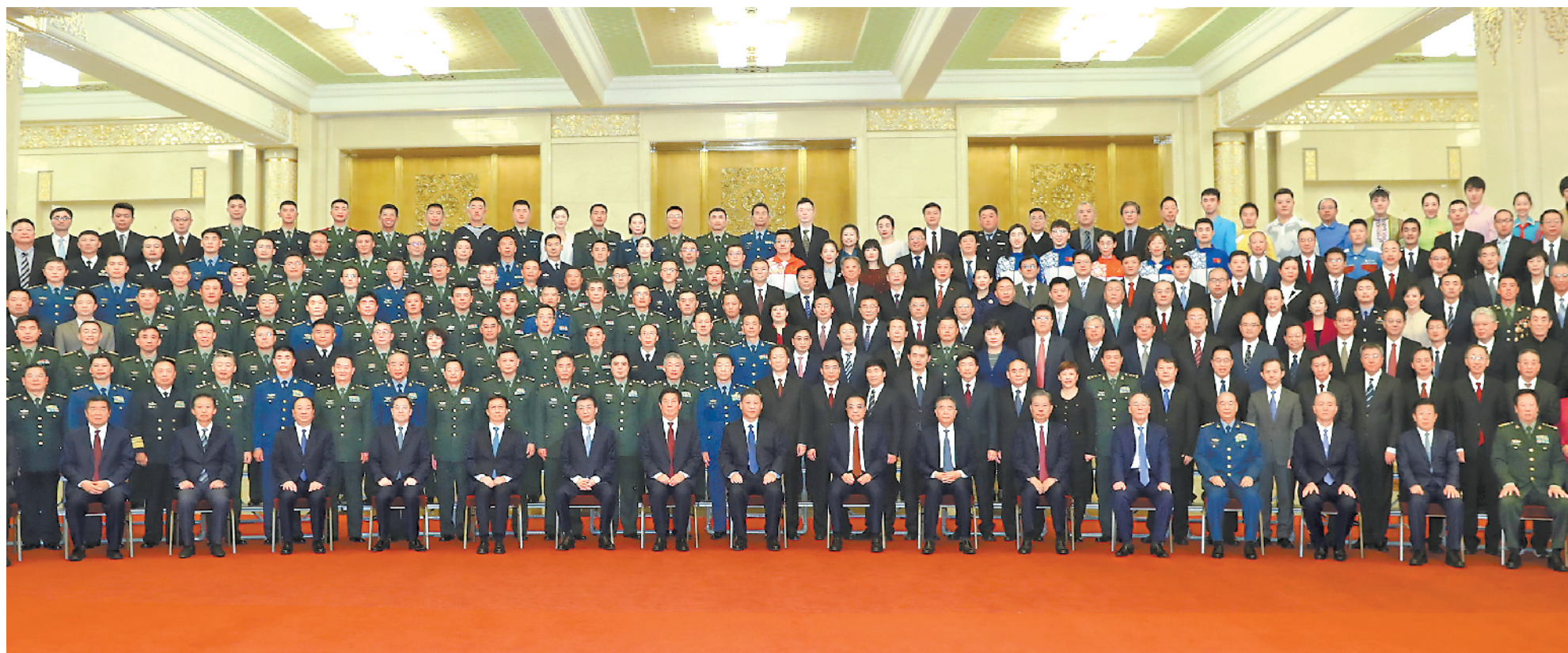
10月16日,党和国家领导人习近平、李克强、栗战书、汪洋、王沪宁、赵乐际、韩正、王岐山等在北京人民大会堂会见中华人民共和国成立70周年庆祝活动筹办工作有关方面代表。

●这次庆祝活动是国之大典,气势恢弘、大度雍容,纲维有序、礼乐交融,充分展示了新中国成立 70 年来的辉煌成就,有力彰显了国威军威,极大振奋了民族精神,广泛激发了各方面力量 ●庆祝活动是在第一个百年即将到来之际,全党全军全国各族人民万众一心,朝着全面建成小康社会目标奋进的一次伟大凝聚;是在实现中华民族伟大复兴中国梦的征程上,全体中华儿女对共同理想所作的一次豪迈宣示;是在当今世界正经历百年未有之大变局的形势下,中华人民共和国始终巍然屹立于世界东方,并且愈发蓬勃、愈发健强的一次盛大亮相