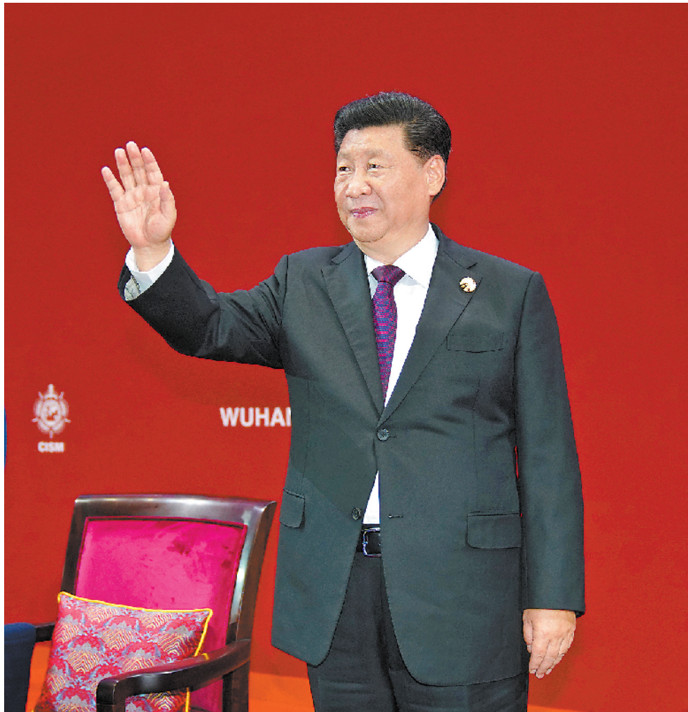
10月18日,中共中央总书记、国家主席、中央军委主席习近平在武汉出席第七届世界军人运动会开幕式并宣布运动会开幕。

本报武汉10月18日电 记者王士彬、尹航、欧阳浩报道:创军人荣耀,筑世界和平。第七届世界军人运动会18日晚在湖北省武汉市隆重开幕。中共中央总书记、国家主席、中央军委主席习近平出席开幕式并宣布运动会开幕。