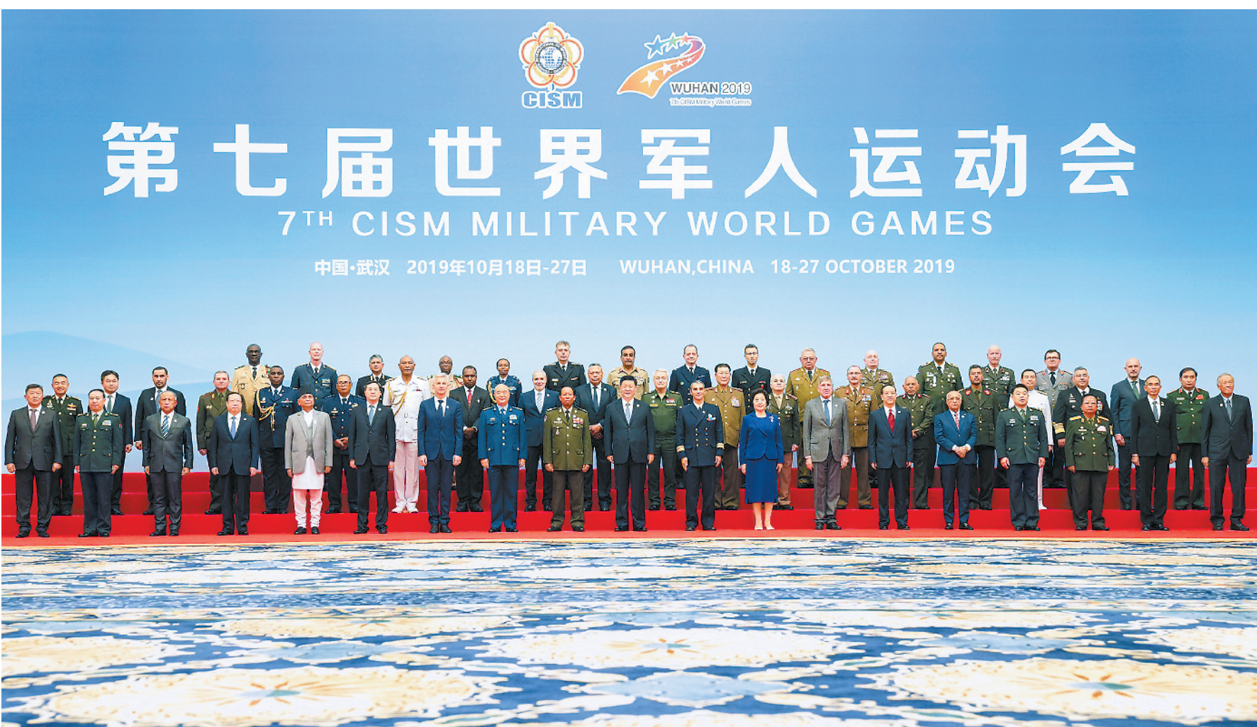
10月18日下午,中共中央总书记、国家主席、中央军委主席习近平在武汉集体会见应邀出席第七届世界军人运动会开幕式的各国防务部门和军队领导人及国际军事体育理事会主要官员,代表中国政府、中国人民和中国军队向出席活动的各国防务部门和军队领导人、国际军事体育理事会官员、各国运动员表示热烈欢迎。图为会见前,习近平同出席第七届世界军人运动会开幕式的各国防务部门和军队领导人及国际军事体育理事会主要官员合影。