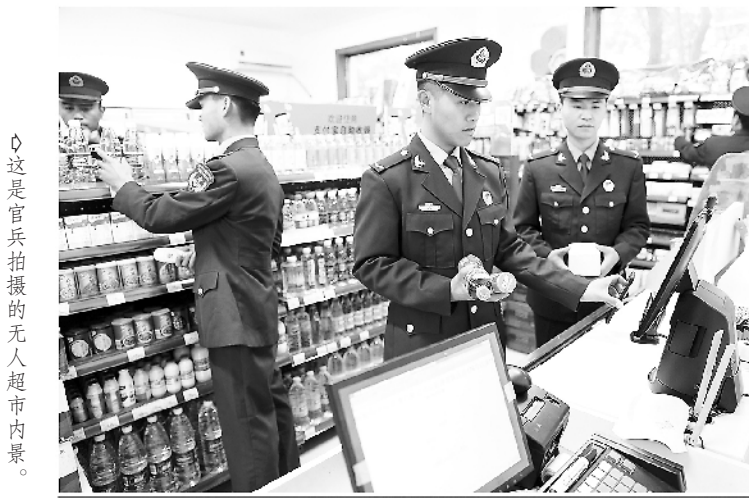
这是官兵拍摄的无人超市内景。