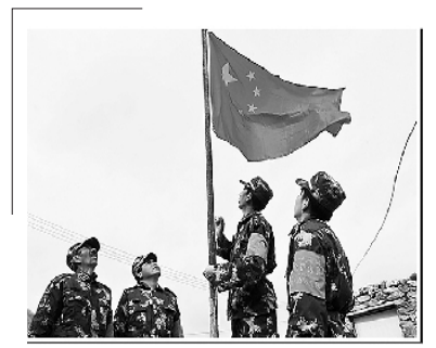
在边境线上升起五星红旗，这是护边员每天必须做的一件事。