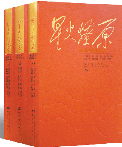
《星火燎原》精选本平装版，定价：188元