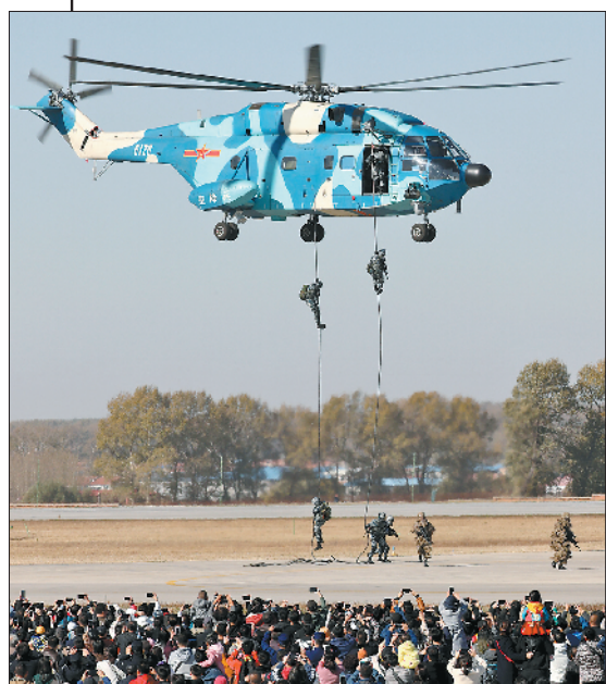
空降兵空中突击行动惊险激烈。