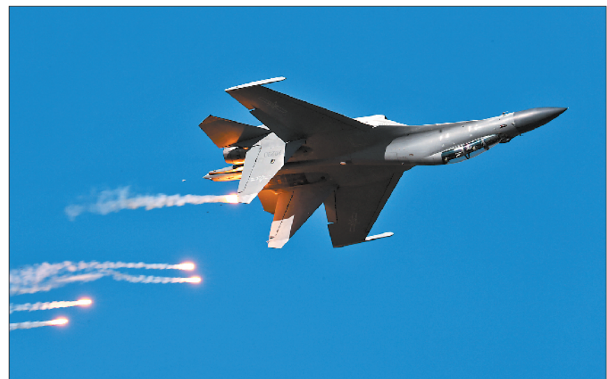
歼-16战机展示低空连续横滚战术动作。

多型武器装备精彩亮相，多支跳伞、飞行表演队共舞蓝天……10月17日至21日，庆祝人民空军成立70周年航空开放活动在吉林省长春市举办。此次活动突出“壮阔七十年，奋飞新时代”主题，展现了实战空军、转型空军、战略空军的崭新形象。 活动现场人头攒动，气氛热烈。八一跳伞队和“蓝鹰”跳伞队降落伞迎风绽放，扮靓九天；“天之翼”“红鹰”和八一飞行表演队把蓝天当作舞台，赋予钢铁翅膀灵动的生命，在穹顶之下上演精彩纷呈的视觉盛宴；惊险激烈的空降兵空中突击行动展示中，特种兵进行了直升机滑降、定点狙杀、近身捕俘等课目演示，成功完成“人质解救行动”，展现了空军部队实战化训练成果；大坡度“8”字盘旋、近垂直仰角急速拉升、斜斤斗翻转机动……歼-20、运-20、歼-16、歼-11BS等一批新型主力战机展翅苍穹，在观众的欢呼声中展现出优异性能。 70年长砺剑，70年逐梦空天。此次航空开放活动共吸引来自全国各地45万余名观众参与，生动展示了人民空军70年建设发展成就，彰显了新时代人民空军开放、自信的姿态和捍卫国家主权、安全、发展利益的坚定决心。