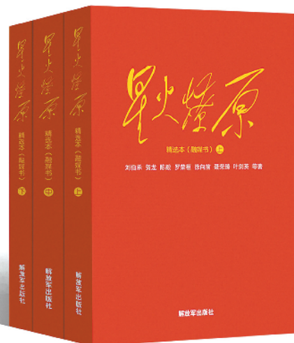
《星火燎原》精选本精装版，定价：188元 《星火燎原》精选本大字版，定价：218元