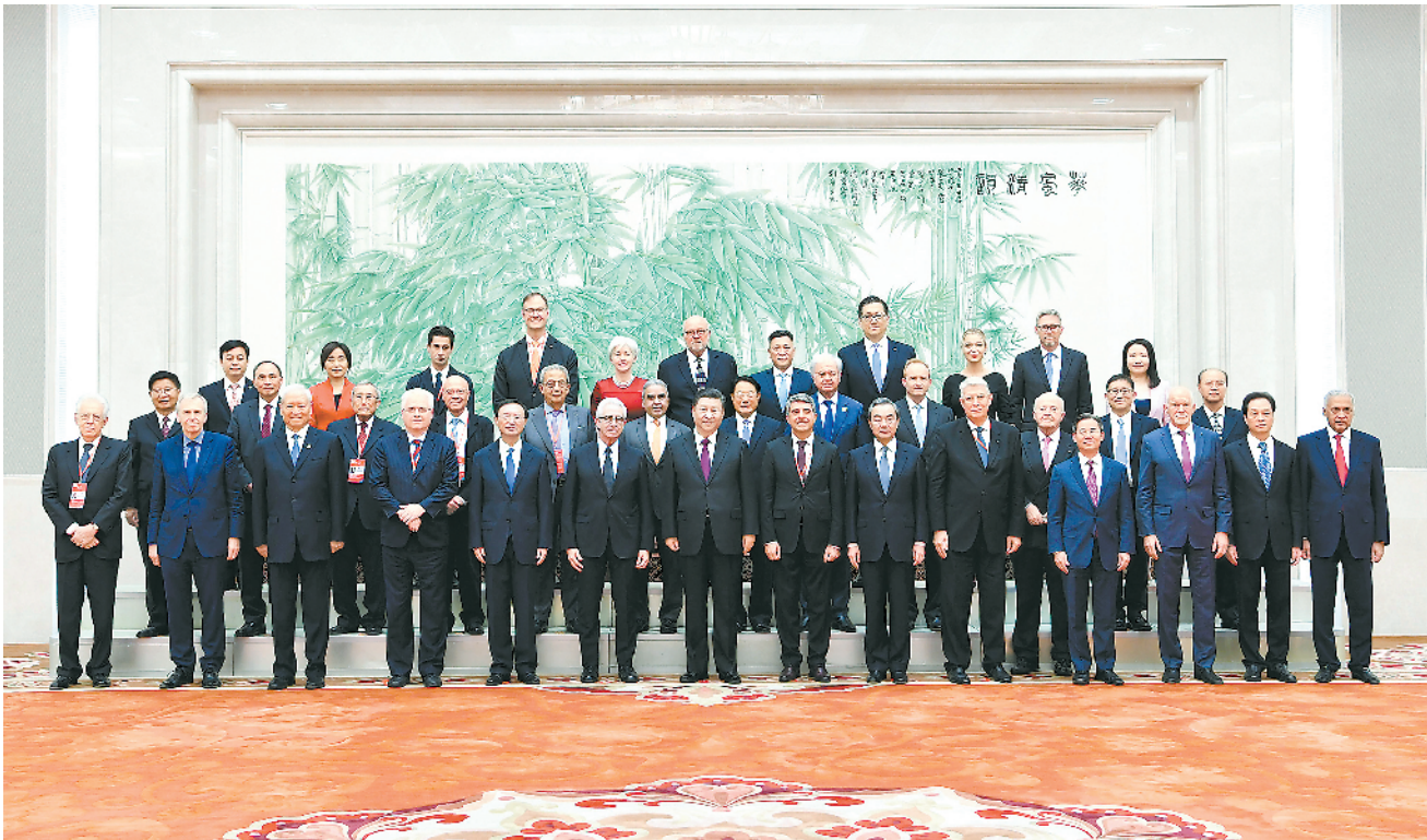
10月25日,国家主席习近平在北京人民大会堂会见出席2019年“读懂中国”国际会议的外方嘉宾代表,同他们集体合影。

新华社北京10月25日电 (记者白洁)国家主席习近平25日在人民大会堂会见出席2019年“读懂中国”国际会议的外方嘉宾代表,同他们集体合影。习近平希望他们加强同中国的交流,真