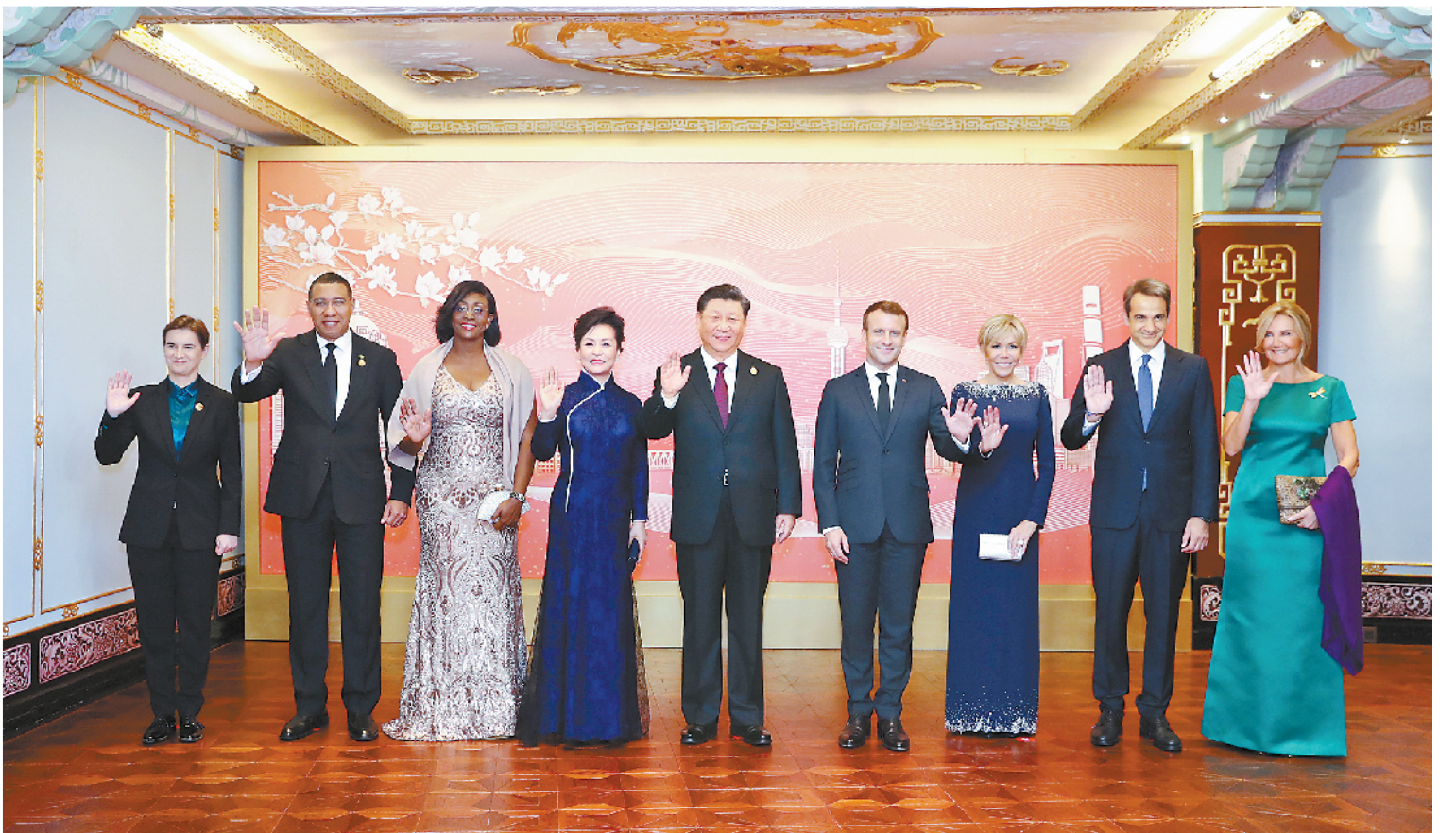
11月4日晚,国家主席习近平和夫人彭丽媛在上海和平饭店举行宴会,欢迎出席第二届中国国际进口博览会的各国贵宾。这是习近平发表致辞。