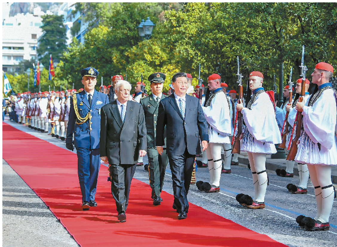
当地时间11月11日,国家主席习近平在雅典同希腊总统帕夫洛普洛斯会谈。这是会谈前,帕夫洛普洛斯为习近平举行隆重欢迎仪式。