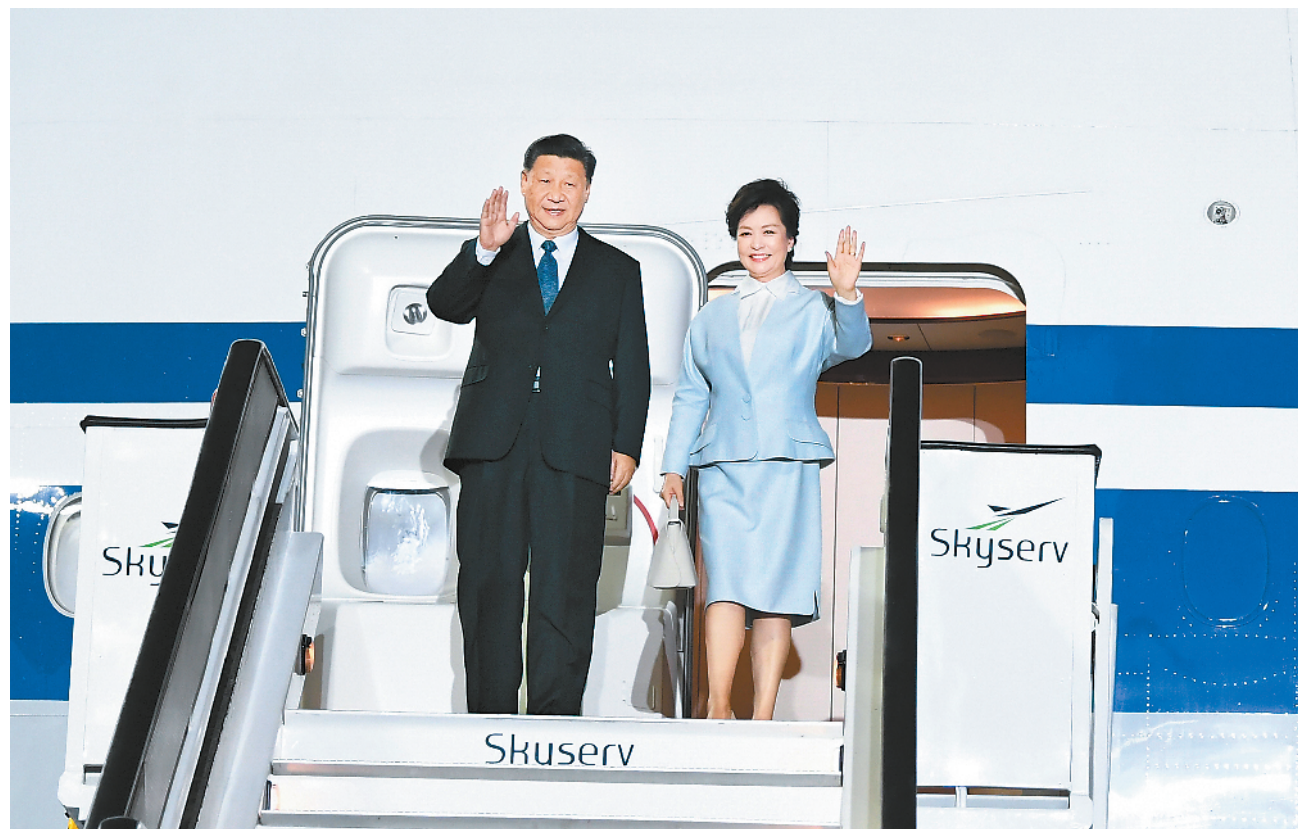
当地时间11月10日晚,国家主席习近平乘专机抵达雅典国际机场,开始对希腊共和国进行国事访问。这是习近平和夫人彭丽媛步出专机舱门。