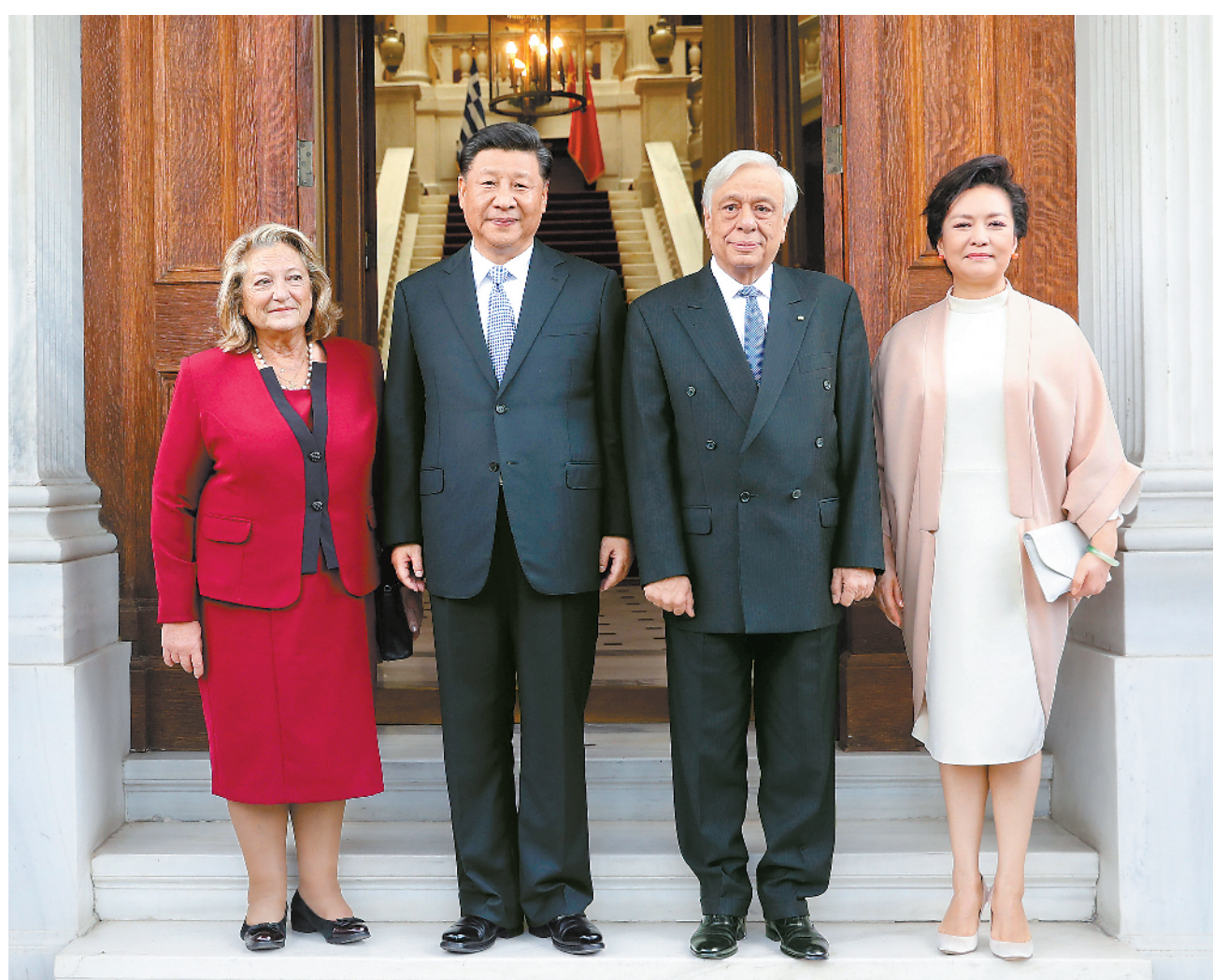
当地时间11月11日,国家主席习近平在雅典同希腊总统帕夫洛普洛斯会谈。会谈前,帕夫洛普洛斯为习近平举行隆重欢迎仪式。这是习近平和夫人彭丽媛同帕夫洛普洛斯和夫人弗拉西娅合影。

当天,习近平向希腊无名战士纪念碑献花圈。丁薛祥、杨洁篪、王毅、何立峰等参加上述活动。