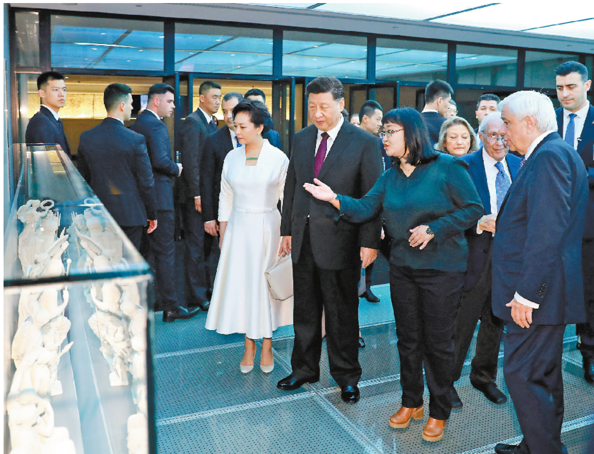
当地时间十一月十二日，国家主席习近平和夫人彭丽媛在希腊总统帕夫洛普洛斯夫妇陪同下，参观雅典卫城博物馆。