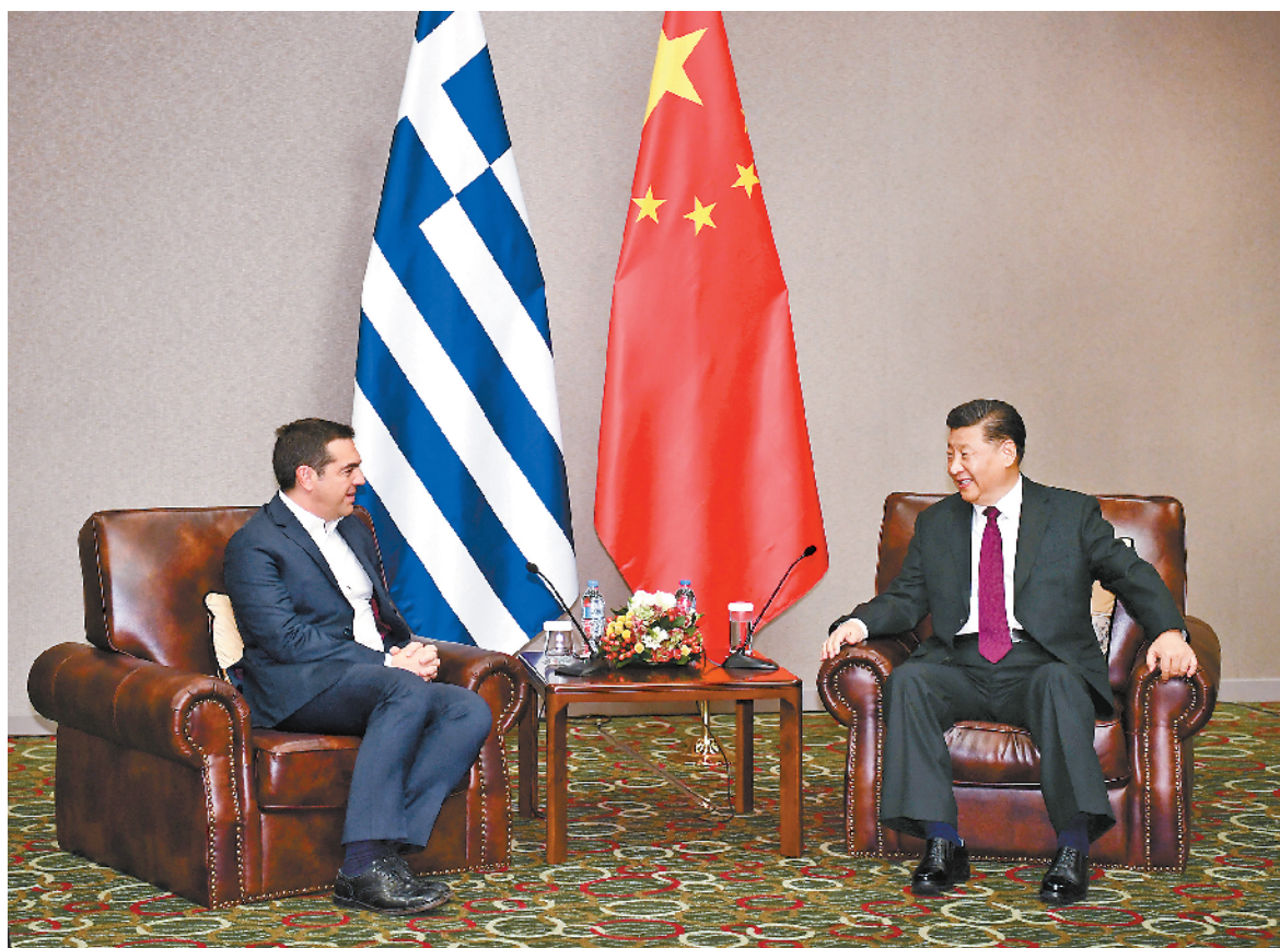
当地时间十一月十二日，国家主席习近平在雅典会见希腊前总理齐普拉斯。

新华社雅典11月12日电（记者李建敏、党琦）当地时间11月12日，国家主席习近平在雅典会见希腊前总理齐普拉斯。 习近平高度评价齐普拉斯担任希腊总理期间为推动中希友好合作所作的努力。习近平指出，国与国交往既要讲利，更要重义。赠人玫瑰，手有余香。中方始终坚定支持希腊政府和人民应对金融危机影响，坚定推进两国务实合作。我高兴地看到，希腊经济已经走出了困难，