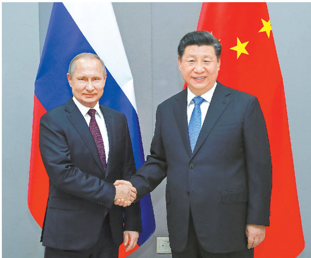
当地时间 11 月 13 日,国家主席习近平在巴西利亚会见俄罗斯总统普京。