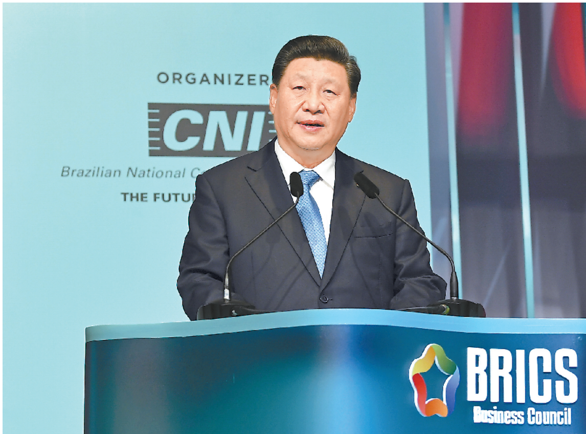
当地时间 11 月 13 日,金砖国家工商论坛闭幕式在巴西利亚举行。国家主席习近平出席并发表讲话。

第一,营造和平稳定的安全环境。应该以维护世界和平、促进共同发展为目标,以维护公平正义、推动互利共赢为宗旨,以国际法和公认的国际关系基本准则为基础,倡导并践行多边主义。要维护联合国宪章宗旨和原则,维护以联合国为核心的国际体系,反对霸权主义和强权政治,建设性参与地缘政治热点问题解决进程。密切战略沟通和协作,发出金砖共同声音,推动国际秩序朝着更加公正合理的方向发展。