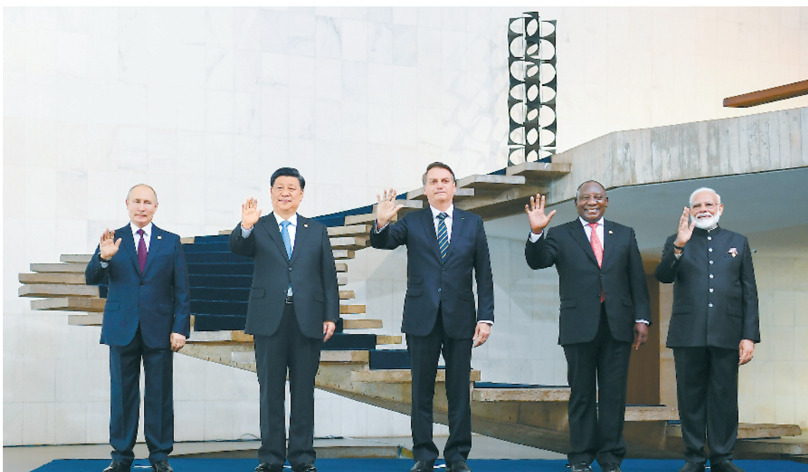
当地时间 11 月 14 日,金砖国家领导人第十一次会晤在巴西首都巴西利亚举行。巴西总统博索纳罗主持会晤。中国国家主席习近平、俄罗斯总统普京、印度总理莫迪、南非总统拉马福萨出席。这是五国领导人合影。