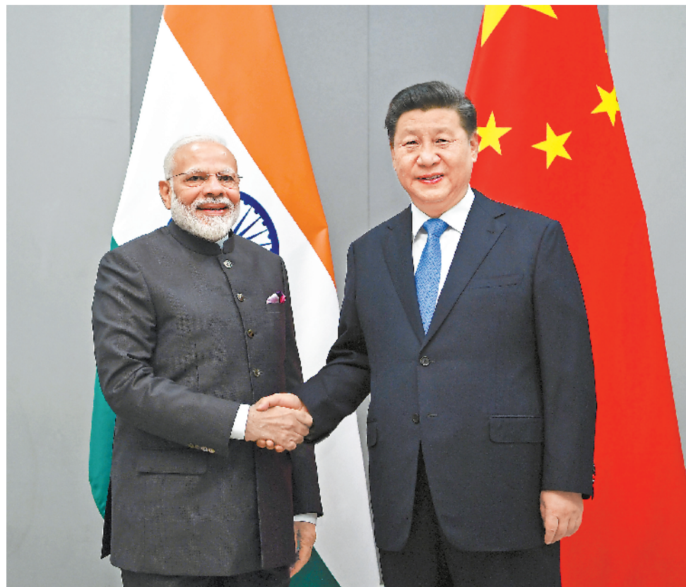
当地时间 11 月 13 日,国家主席习近平在巴西利亚会见印度总理莫迪。

习近平强调,在刚刚结束的第二届中国国际进口博览会上,俄方参展企业成交额比上届增长 74%。要持续扩大双边贸易规模。中俄东线天然气管道项目即将投产通气,期待两国能源领域更多战略性大项目落地开花。(下转第四版)