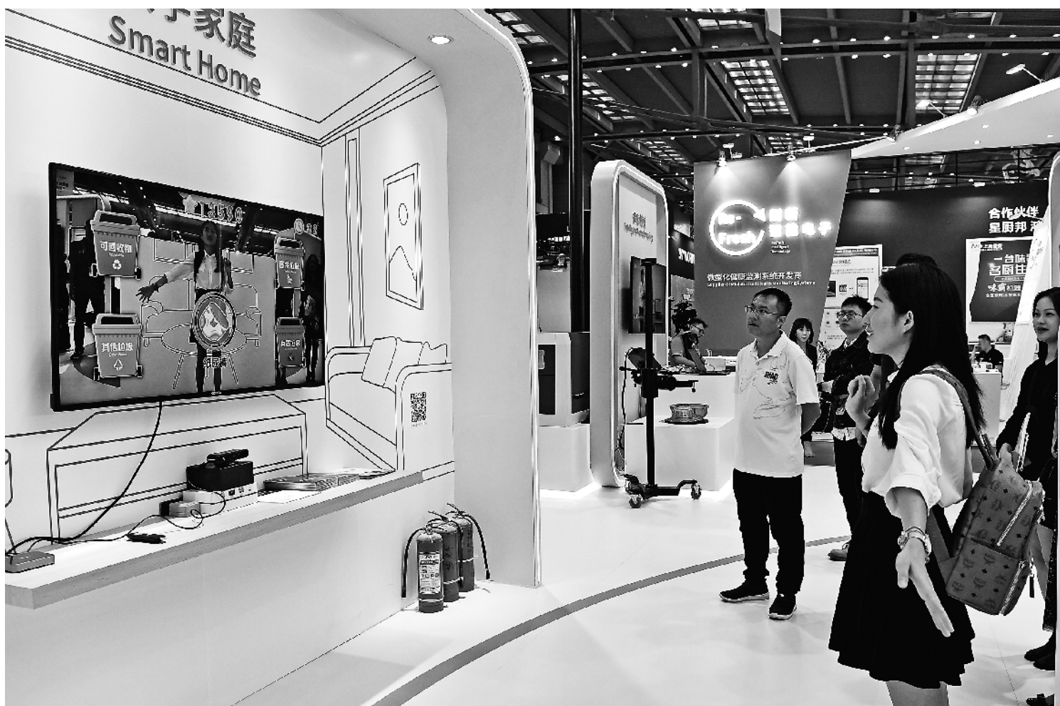
11月13日至17日,第21届中国国际高新技术成果交易会在深圳举行,一大批前沿技术成果集中亮相。图为观众在现场参与垃圾分类互动游戏。