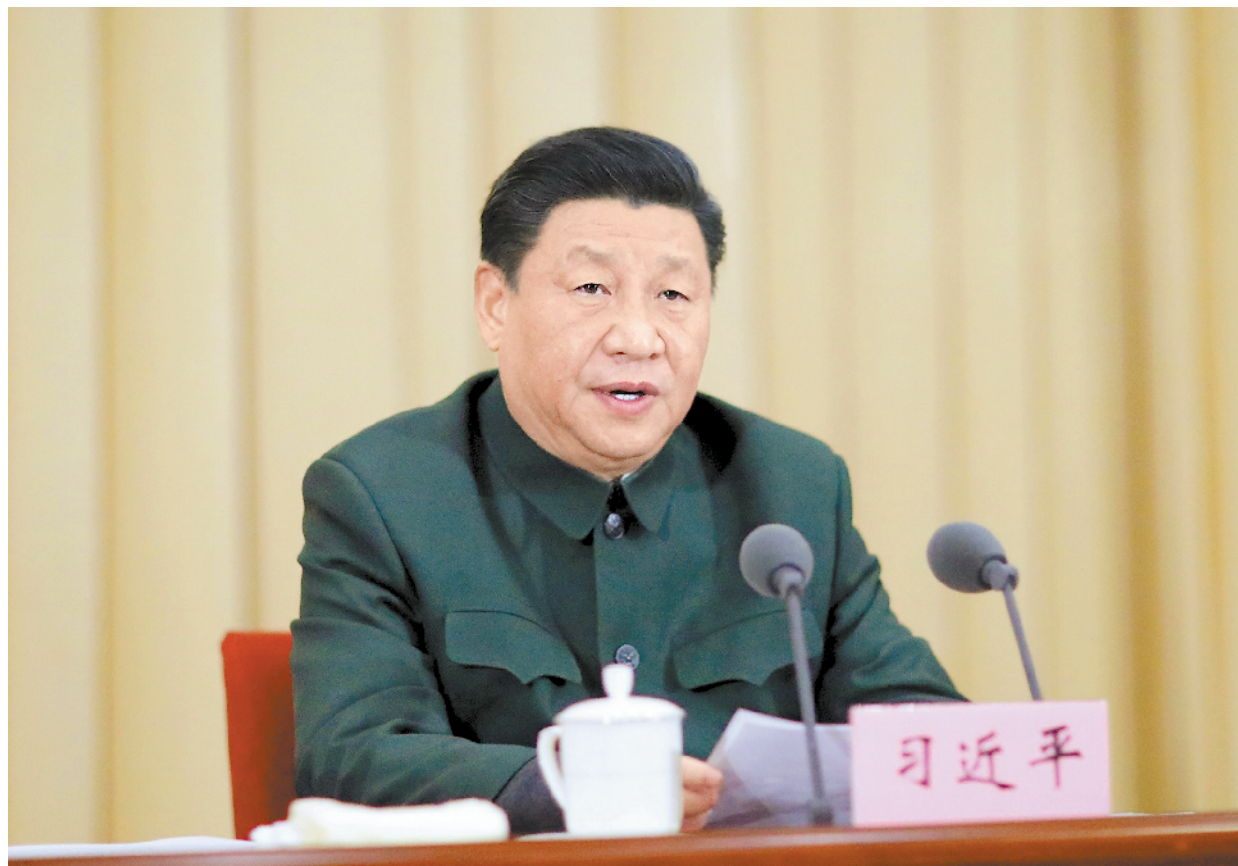
十一月二十七日,上午,全军院校长集训在国防大学开班。中共中央总书记、国家主席、中央军委主席习近平出席开班式并发表重要讲话。