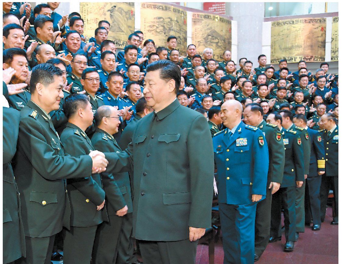
十一月二十七日,上午,全军院校长集训在国防大学开班。中共中央总书记、国家主席、中央军委主席习近平出席开班式并发表重要讲话,代表党中央和中央军委,向全军院校长和军事教育战线同志们致以诚挚问候。这是习近平亲切接见集训班全体学员。

本报北京11月27日电 记者王士彬、刘建伟、罗金沐报道:全军院校长集训今天上午在国防大学开班。中共中央总书记、国家主席、中央军委主席习近平出席开班式并发表重要讲话,代表党中央和中央军委,向全军院校长和军事教育战线的同志们致以诚挚问候。他强调,强军之道,要在得人。要全面贯彻新时代军事教育方针,全面实施人才强军战略,全面深化军事院校改革创新,把培养人才摆在更加突出的位置,培养德才兼备的高素质、专业化新型军事人才。 上午10时30分许,习近平来到国防大学。在热烈的掌声中,习近平亲切接见集训班全体学员,同大家合影留念。 习近平在讲话中指出,发展军事教育,必须有一个管总的方针,解决好培养什么人、怎样培养人、为谁培养人这个根本问