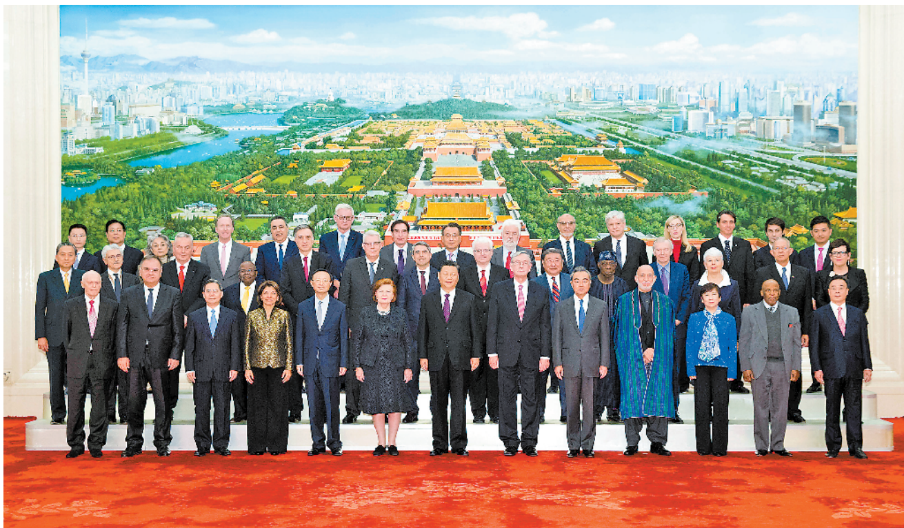
12月3日,国家主席习近平在北京人民大会堂会见出席“2019从都国际论坛”外方嘉宾。这是会见前,习近平同外方嘉宾集体合影。