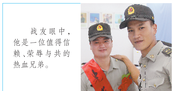
战友眼中，他是一位值得信赖、荣誉与共的热血兄弟。

翻阅他写下的一篇篇笔记，点开他发在朋友圈的一条条微信，端详他留下的一张照片，大家在追思回忆中发现，强军思想的入脑入心是壮举之根，坚如磐石的信仰信念是力量之源。