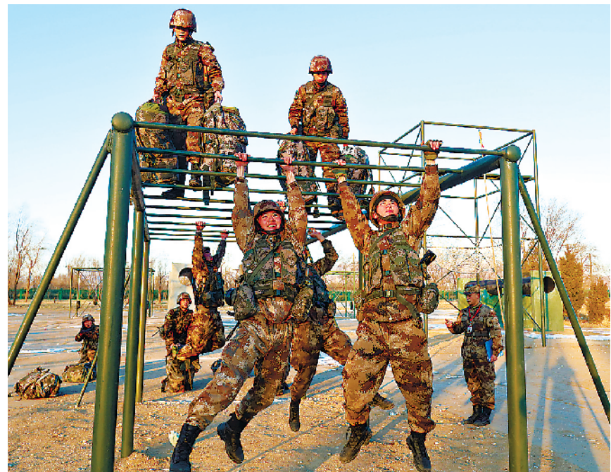
“八大员”们正在接受考核。