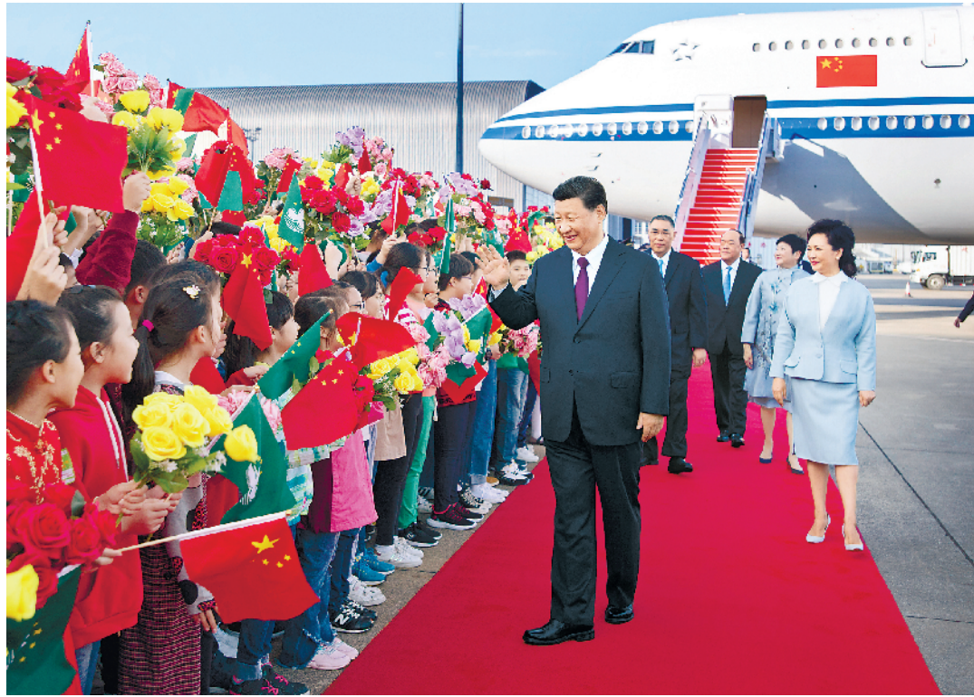
12月18日,中共中央总书记、国家主席、中央军委主席习近平乘专机抵达澳门,出席将于20日举行的庆祝澳门回归祖国20周年大会暨澳门特别行政区第五届政府就职典礼并视察澳门。这是习近平和夫人彭丽媛向欢迎人群致意。

行政区第五届政府就职典礼并对澳门进行视察 出席庆祝澳门回归祖国二十周年大会暨澳门特别