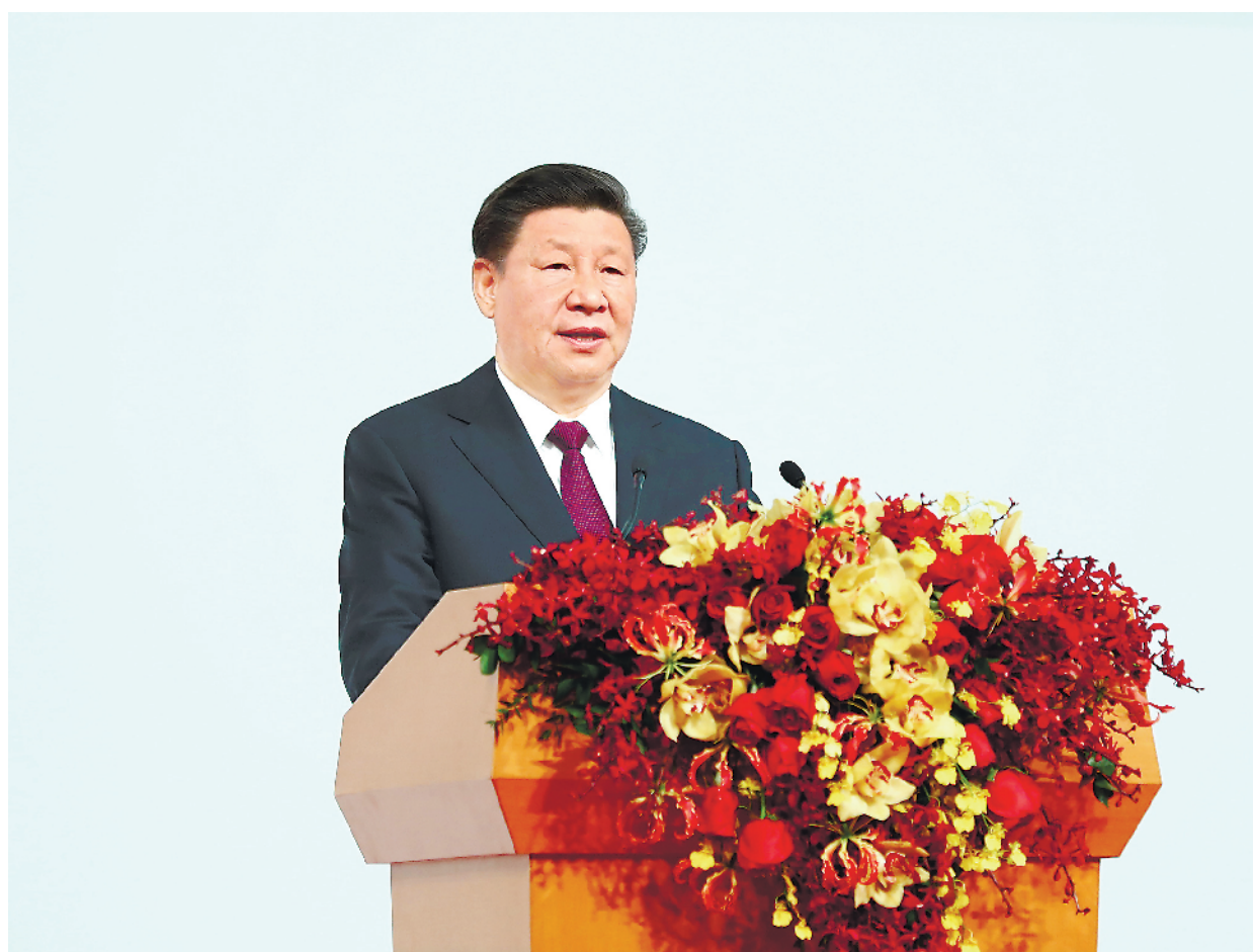
12月20日,庆祝澳门回归祖国20周年大会暨澳门特别行政区第五届政府就职典礼在澳门东亚运动会体育馆隆重举行。中共中央总书记、国家主席、中央军委主席习近平出席并发表重要讲话。

习近平指出,澳门回归祖国20年来,澳门特别行政区政府和社会各界人士同心协力,开创了澳门历史上最好的发展局面,谱写了具有澳门特色的“一国两制”成功实践的华彩篇章。希望澳门特别行政区新一届政府和社会各界人士站高望远、居安思危,守正创新、务实有为,在已有成就的基础上推动澳门特别行政区各项建设事业跃上新台阶