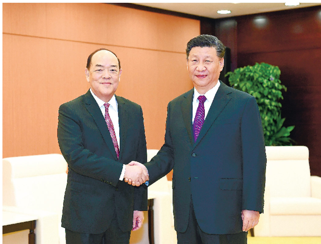
12月20日,国家主席习近平在澳门会见刚刚就职的澳门特别行政区行政长官贺一诚。