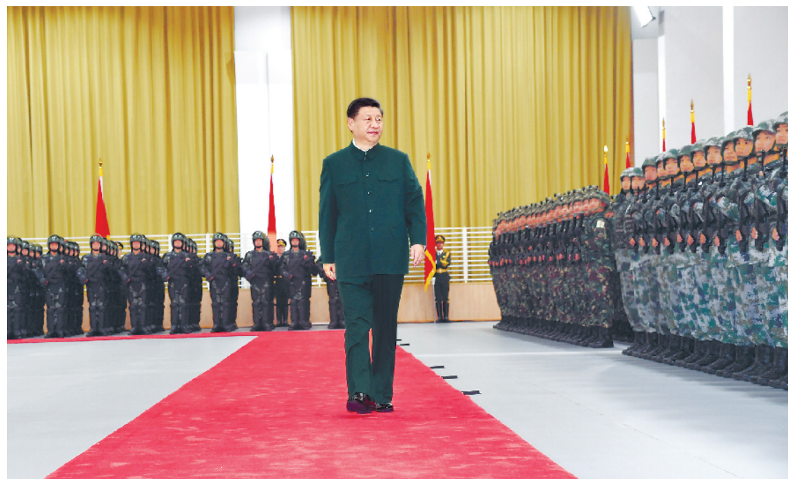
十二月二十日,中共中央总书记、国家主席、中央军委主席习近平视察中国人民解放军驻澳门部队,代表党中央和中央军委向驻澳门部队全体官兵致以诚挚的问候。这是习近平检阅驻澳门部队。