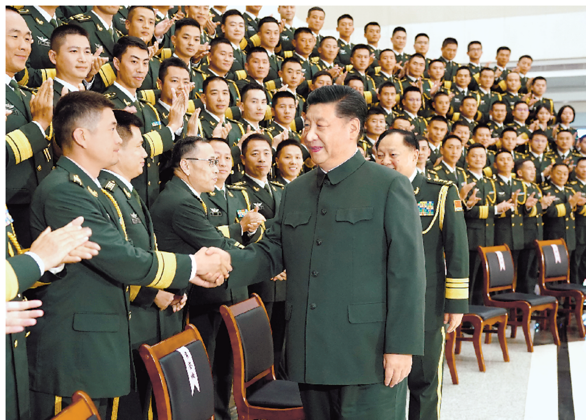
十二月二十日,中共中央总书记、国家主席、中央军委主席习近平视察中国 人民解放军驻澳门部队,代表党中央和中央军委向驻澳门部队全体官兵致以 诚挚的问候。这是习近平亲切接见驻澳门部队全体干部。