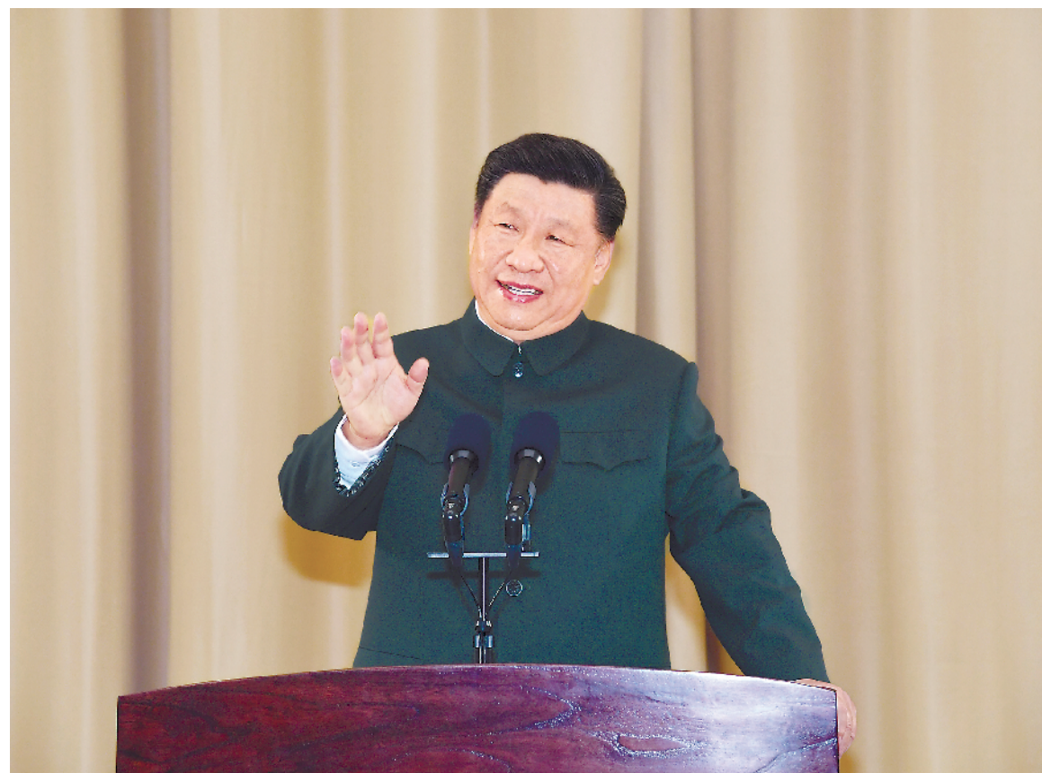
十二月二十日,中共中央总书记、国家主席、中央军委主席习近平视察中国 人民解放军驻澳门部队,代表党中央和中央军委向驻澳门部队全体官兵致以 诚挚的问候。这是习近平发表重要讲话。