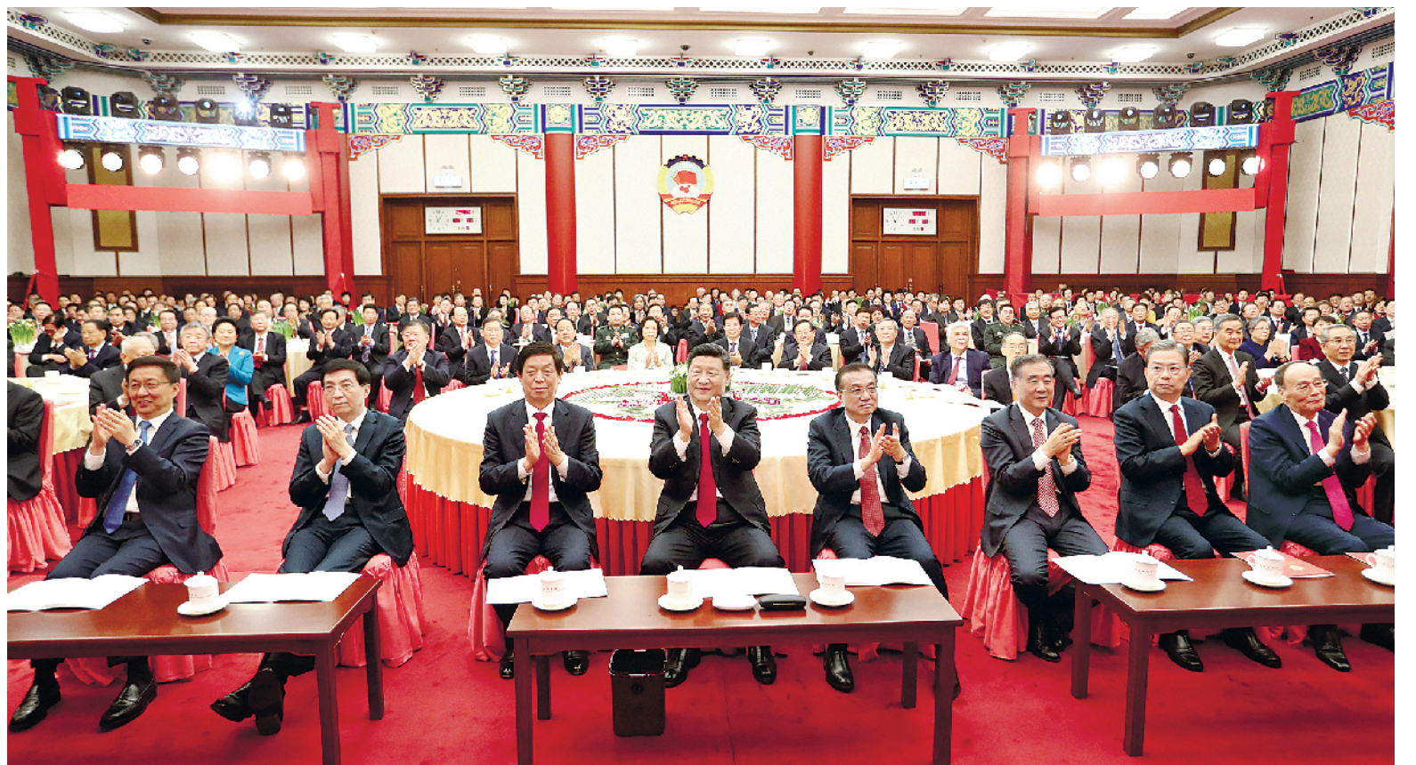
12月31日,全国政协在北京举行新年茶话会。党和国家领导人习近平、李克强、栗战书、汪洋、王沪宁、赵乐际、韩正、王岐山出席茶话会并观看演出。

新华社北京12月31日电 (记者杨维汉、林晖)中国人民政治协商会议全国委员会12月31日上午在全国政协礼堂举行新年茶话会。党和国家领导人习近平、李克强、栗战书、汪洋、王沪宁、赵乐际、韩正、王岐山等同各民主党派中央、全国工商联负责人和无党派人士代表、中央和国家机关有关方面负责人以及首都各族各界人士代表欢聚一堂,喜迎2020年元旦。