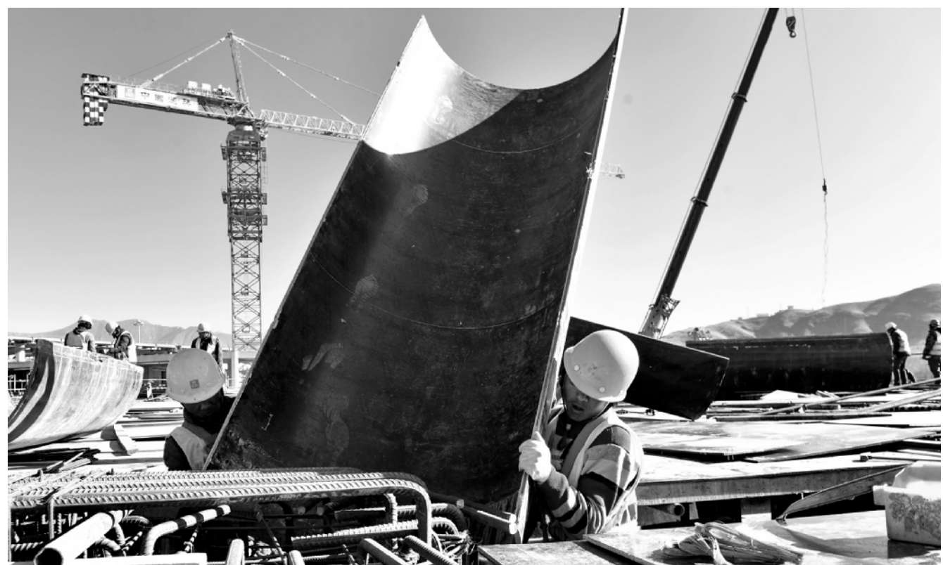
作为“空中天路”的起点,西藏拉萨贡嘎机场是西藏第一大航空枢纽。为满足西藏航空业务快速增长需求,拉萨贡嘎机场航站区改扩建工程于2016年全面启动,新航站楼建成后,将满足每年900万人次的出行需求。近日,在工程现场,多名施工人员推迟返乡时间,保障冬季施工进度。