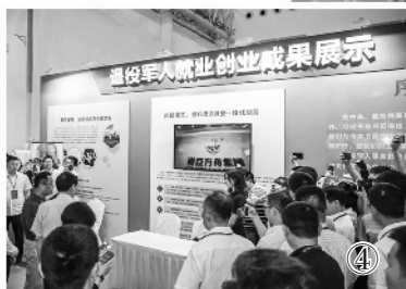
图片由作者提供 制图：张锐

行，对帮扶援助的对象情形、方式方法、保障标准、办理流程等事项作出规范和明确，提高帮扶援助水平。