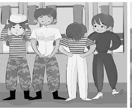
9. 人生最美是军旅,穿军装的样子最好看。