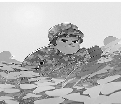
5. “爬战术”体验全身“散架”,一趟下来,“海军蓝”变“陆军绿”。