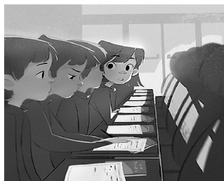
1. 政治教育时间,“学习,我们是认真的!”