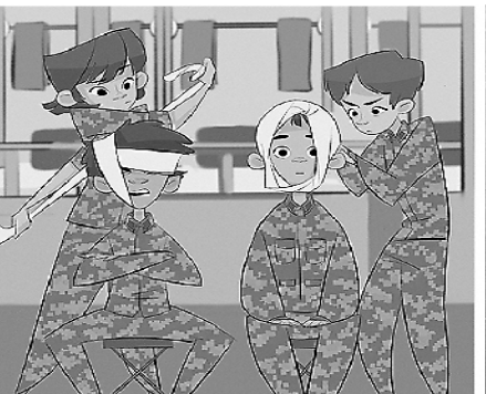
3. 救护课目,“我亲爱的战友,你再不快点,可能就‘救不活’我了!”