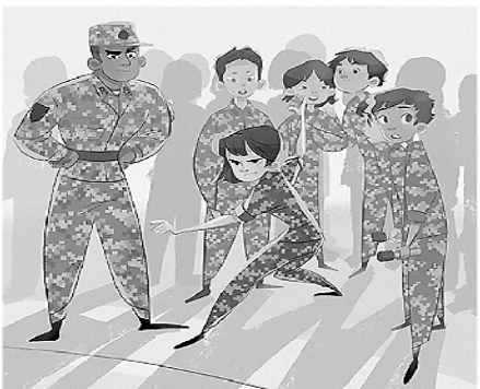
2. 手榴弹投掷,“注意角度,你这姿势投不出‘自杀半径’。”