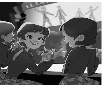
8. 军营大联欢,舞台上的你们多才多艺。