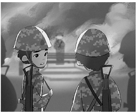
7. 一次次突破自我,“姑娘们,好样的!”