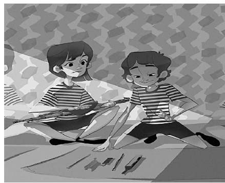
6. 爱护装备像爱护自己的生命。