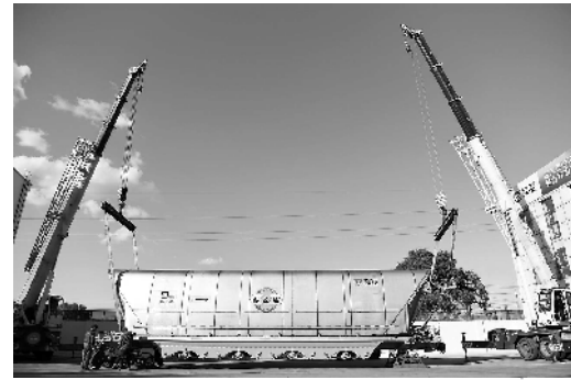
在中车齐齐哈尔车辆有限公司厂区,起重机吊起出口的自卸式煤炭漏斗车。

数据显示,占据东北经济半壁江山的辽宁省,经济增速从2016年负增长,到2017年由负转正,再到2019年上半年的5.8%。李凯认为,总体上,新一轮东北振兴已出现了很多积极因素,东北经济恢复性态势已经形成,但东北振兴仍然面临长期而艰巨的挑战。