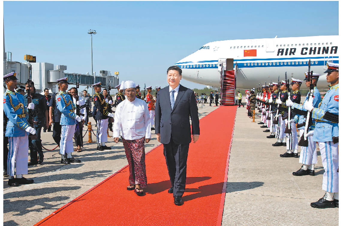
当地时间一月十七日下午,国家主席习近平乘专机抵达内比都国际机场,开始对缅甸联邦共和国进行国事访问。习近平抵达时,缅甸第一副总统敏瑞率多名内阁部长在舷梯旁热情迎接。