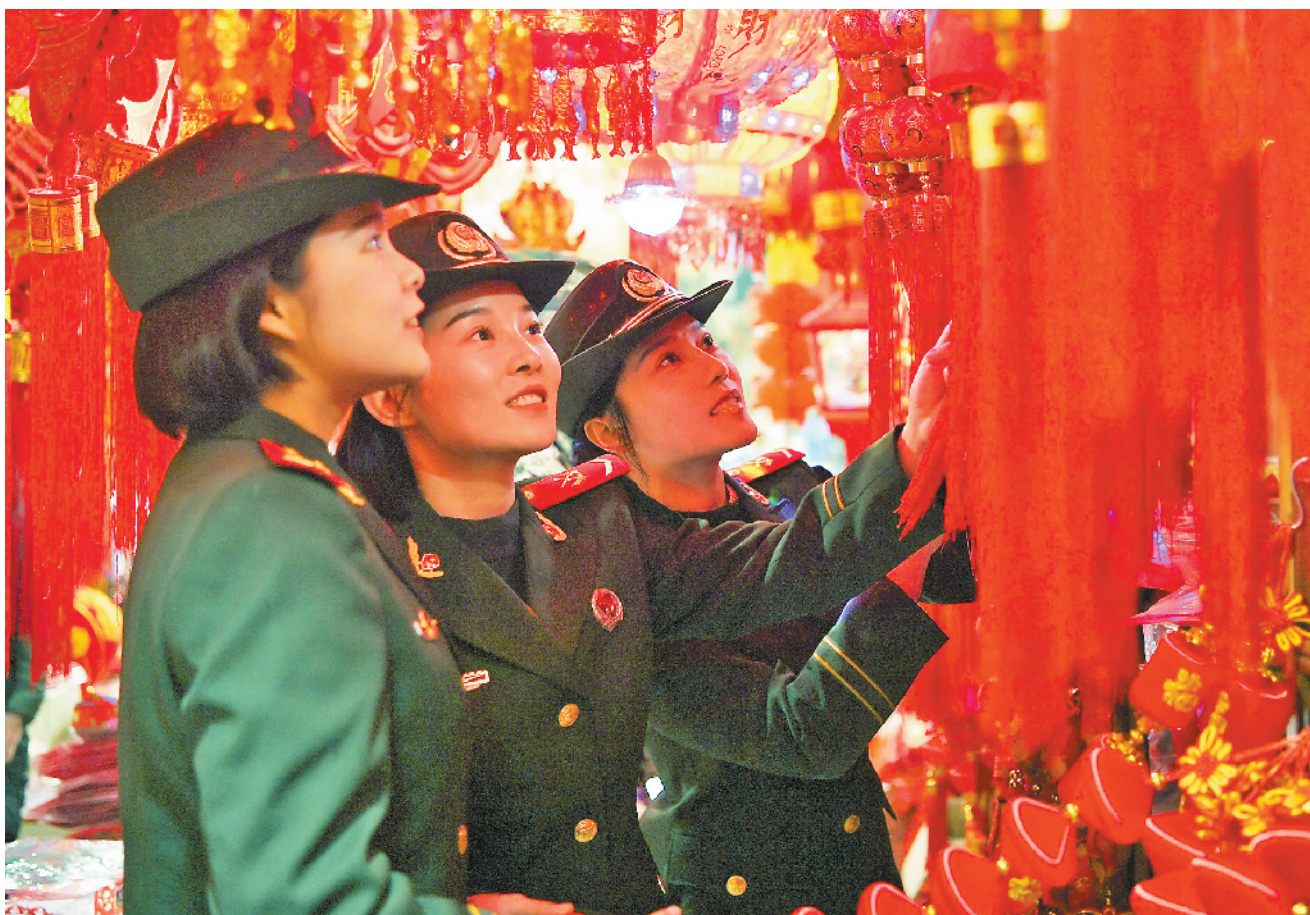
1月14日，武警江西总队官兵到驻地市场采购年货，喜迎新春佳节。

鲜明的评功评奖导向，传递出聚焦战斗力建设的强烈信号。新年伊始，该支队训练场上一片热火朝天的练兵景象，机关和一线执勤单位官兵针对训练短板，积极展开补差训练。