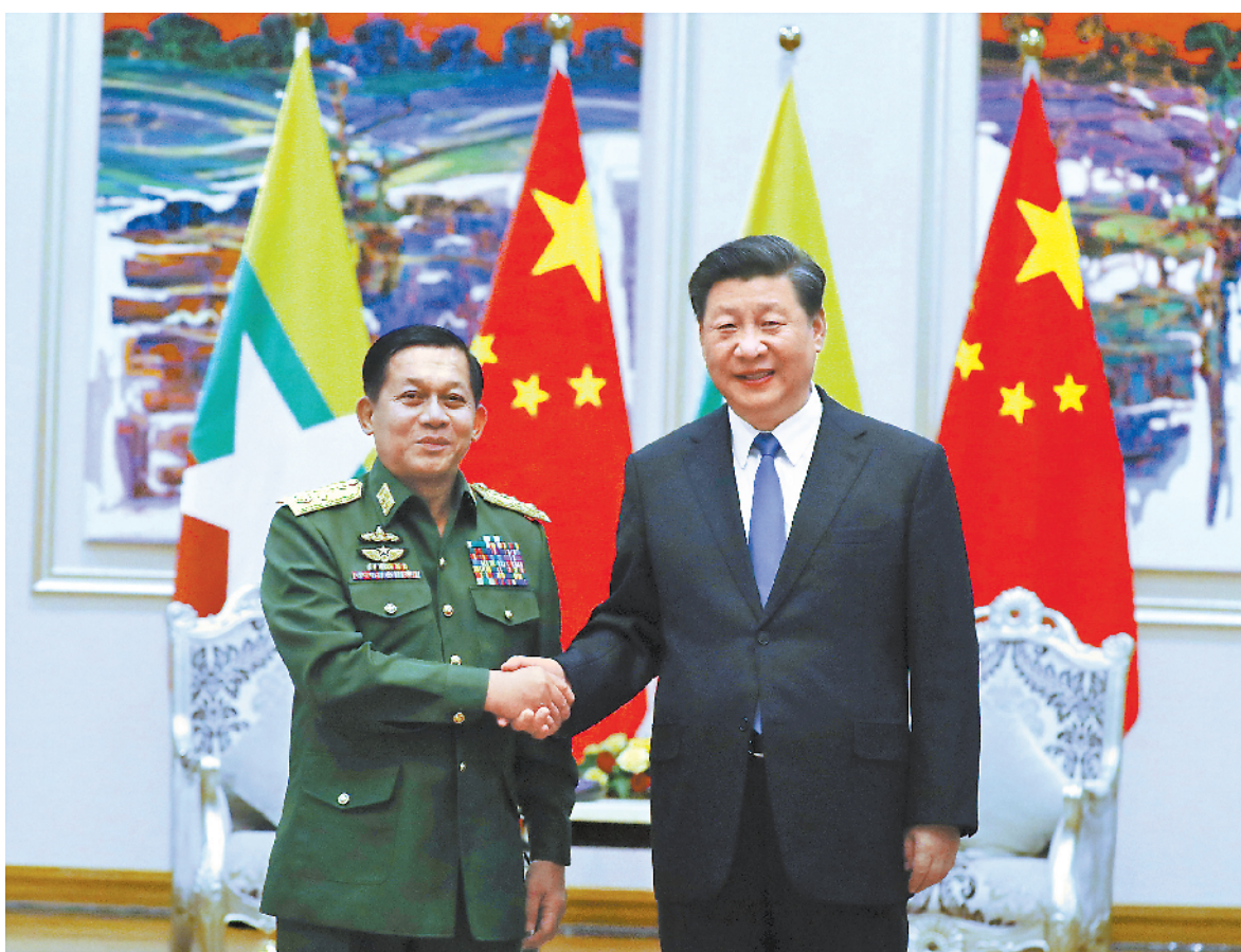
当地时间一月十八日上午,国家主席习近平在内比都下榻饭店会见缅甸国防军总司令敏昂莱。