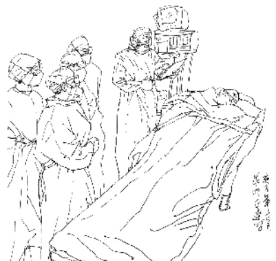
上图:消毒 下图:救治