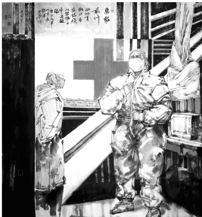
勇敢前行(中国画) 王巨亭作