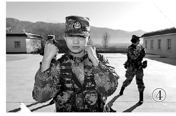
图①:有一种青春,就像三月的高原;图②:只有荒凉的高原,没有寂寞的青春;图③:奋力奔跑,成为更坚强的自己;图④:训练出了成绩,心里比吃了蜜还甜。

青春如花,不同的青春旅途拥有不同的底色。青春亦如纯白画纸,不同的青春经历描绘出不一样的风景。