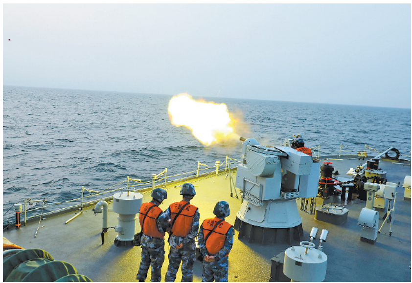
“敌”潜艇在我重要航道布下沉底水雷，企图封锁我舰艇出港航道……2月下旬，北部战区海军某扫雷舰大队接到“敌情”通报。该大队3艘舰艇随即