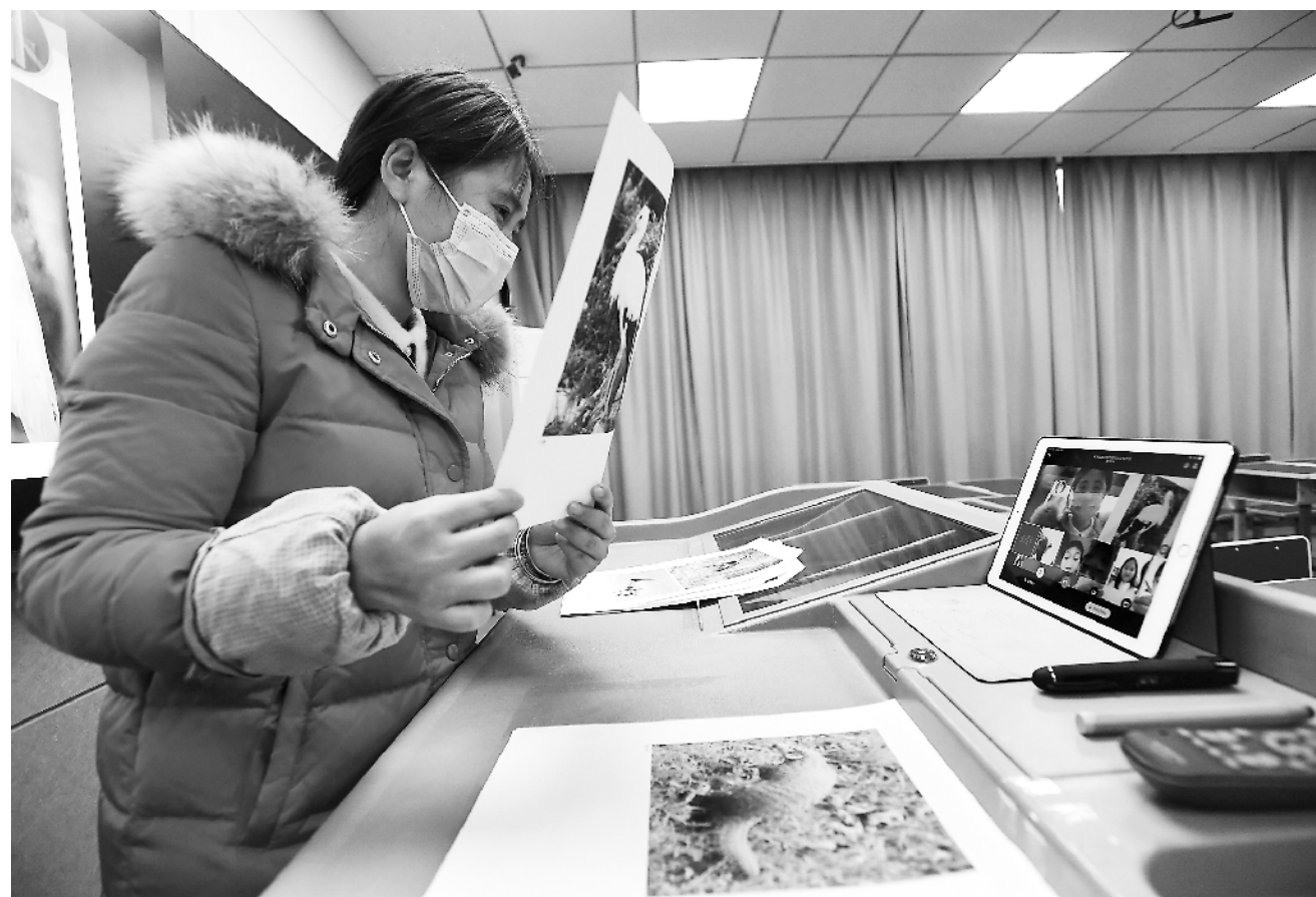
为了给疫情期间居家上课的学生普及相关知识,提高学生保护野生动物的意识,3月2日,江西省樟树市第十小学开设“关爱野生动物 保护美好家园”的特殊网课。图为老师在多媒体教室利用视频直播的形式向学生讲解野生动物知识。