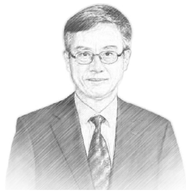
中国人民大学习近平新时代中国特色社会主义思想研究院研究员、法学教授 莫于川