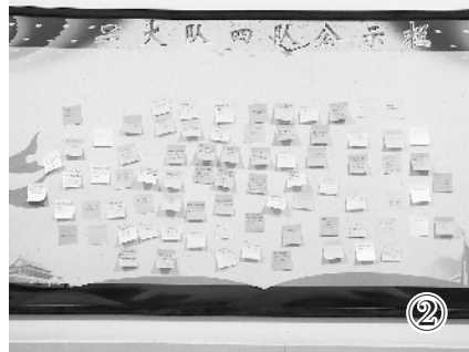
这个由“90”后队干和“00”后学员组成的护校分队,在战“疫”的道路上留下了属于自己的青春印记。