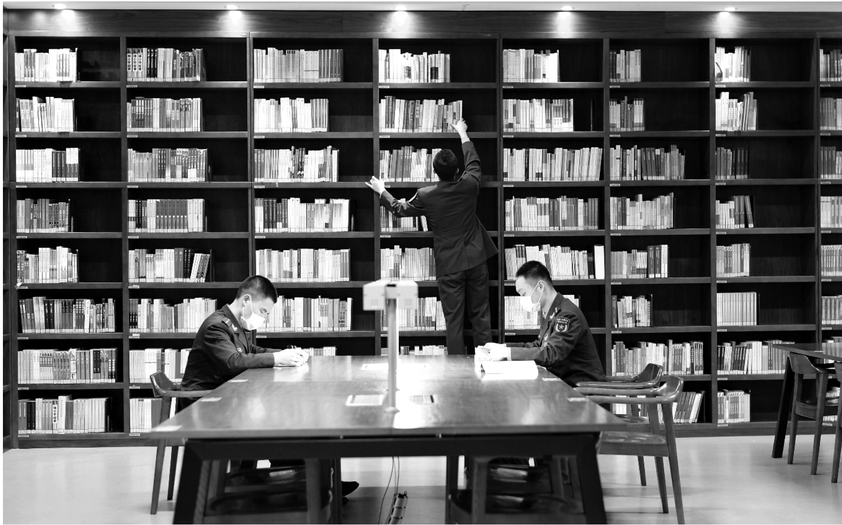
做一颗读书的“种子”，让阅读成为一种力量。