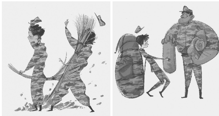
3. 驻训场上的春风，一点都不温柔。 4. 发放拉练物资，班长生怕我落下啥。