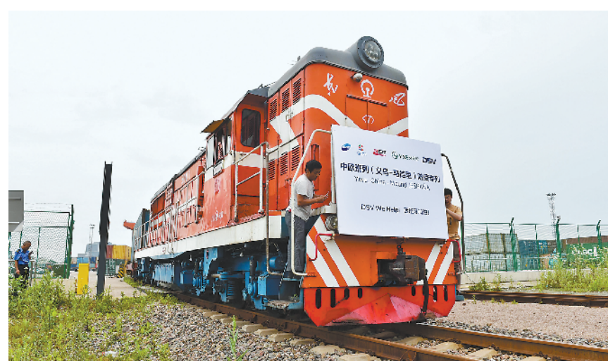
6月5日，满载86个标箱医用外科口罩、防护服等防疫物资的“义新欧”中欧班列(义乌-马德里)在义乌西站鸣笛启程，将经由新疆阿拉山口口岸出境，前往西班牙首都马德里。

据媒体报道，6月1日，美国南加州彭德尔蒙基地的官员宣布，该基地约2000名海军陆战队队员作为“危机应对部队”，近日已经部署到中东地区。与之相呼应的是，5月29日，俄总统普京签署总统令，责成俄国防部和外交部与叙利亚方面展开谈判。俄罗斯计划扩大驻叙利亚军事基地，使自身在中东及地中海地区的立足变得更为稳固。美军增加部署和俄罗斯基地的计划扩建，反映出双方对中东的重视和地区大国博弈的热度。 目前，俄罗斯在叙利亚境内主要有两处军事基地。2015年9月，叙利亚政府请求，俄军入驻叙利亚的赫梅米姆空军基地，帮助叙政府打击叙境内极端分子。尽管目前叙境内局势已大体趋稳，但根据俄叙两国协议，俄军可以无限期部署在赫梅米姆空军基地。另外，塔尔图斯基地是俄海军在前苏联地区之外唯一的军事基地，俄军可以在该基