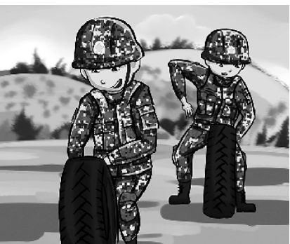
3.“滚轮胎竞技”，拼的是体力加技巧。