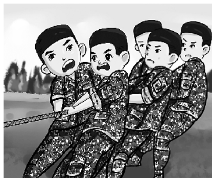
1.野外拔河比赛，别有一番风味。