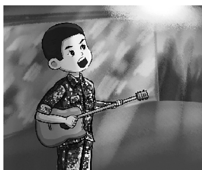
4.驻训小晚会，战友们纷纷展示才艺。