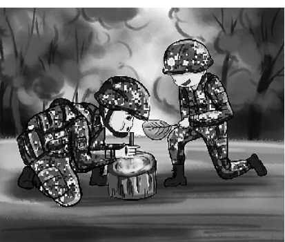
6.野外生存，兵哥哥自带神技“钻木取火”。