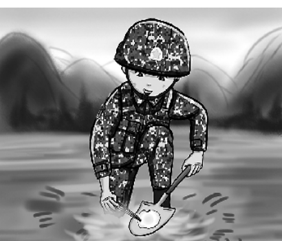
5.厨艺大比拼，我的拿手菜“铁锅煎蛋”。