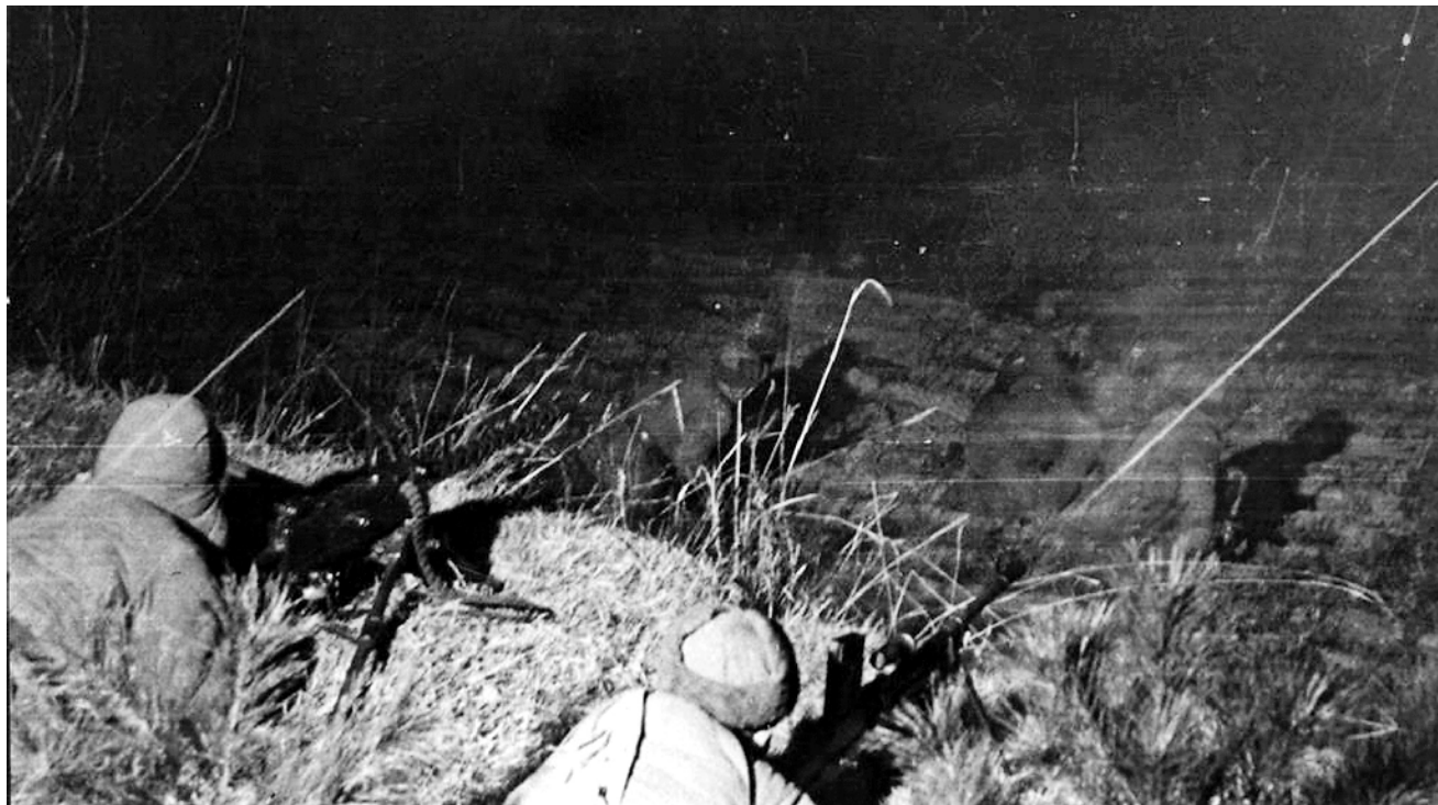
新兴里战斗中，志愿军机枪手发扬火力，痛歼敌人。

第7师第31团号称“北极熊团”，是由第31团3营、第32团1营、第37野战炮兵团和1个重迫击炮连、1个高射炮连组成的团级战斗队。指挥官为第31团团长艾伦·麦克莱恩上校，其官兵多参加过二战，战场经验丰富。美军原计划在东线打开缺口，然后向西线侧后迂回，构成对西线志愿军合围。随着西线战事展开，美第10军军长阿尔蒙德原来在新兴里地区的美军陆战第1师沿长津湖西岸向西突进，让美军第7师第31团赶到新兴里接替第1师的防务，并保护第1师的侧翼安全。长津湖是长津发电站的蓄水湖，处于群山包围之中，东西两侧的山地海拔均超过1300米，地势十分险要。11月下旬，该地区气温已降至零下27摄氏度左