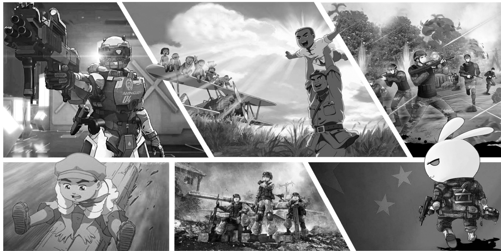
近年来,随着国产动漫的蓬勃发展,军事题材类的动漫作品也日趋丰富,涌现出《闪闪的红星》《那年那兔那些事儿》《聪明的顺溜》等优秀作品。图为部分国产军事动漫作品。制图:唐硕